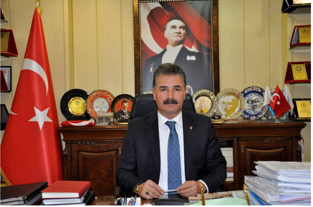
HAMİT TUNA TOROSLAR BELEDİYE BAŞKANI