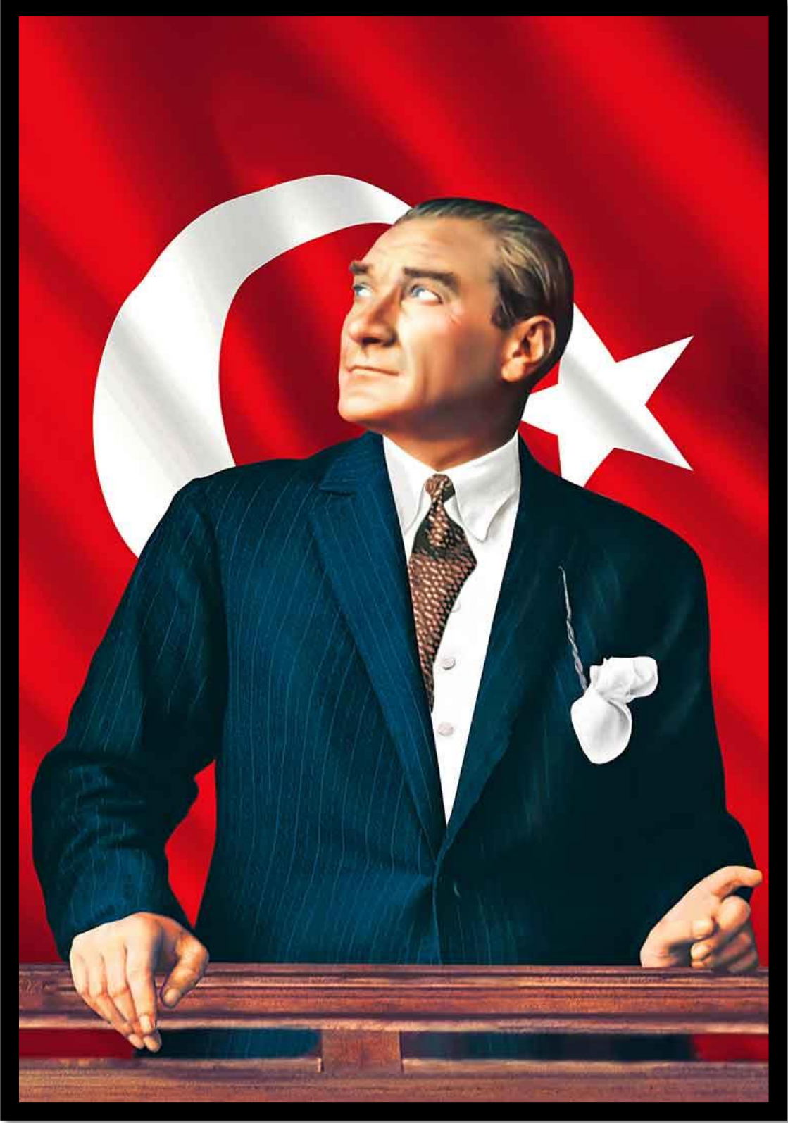
GAZİ MUSTAFA KEMAL ATATÜRK