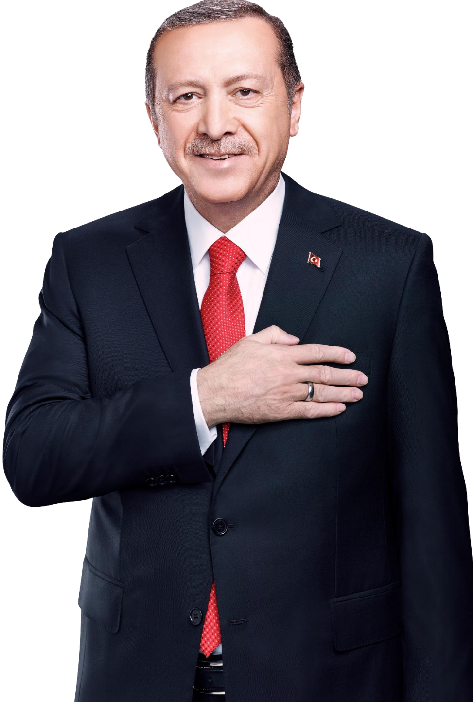
RECEP TAYYİP ERDOĞAN CUMHURBAŞKANI