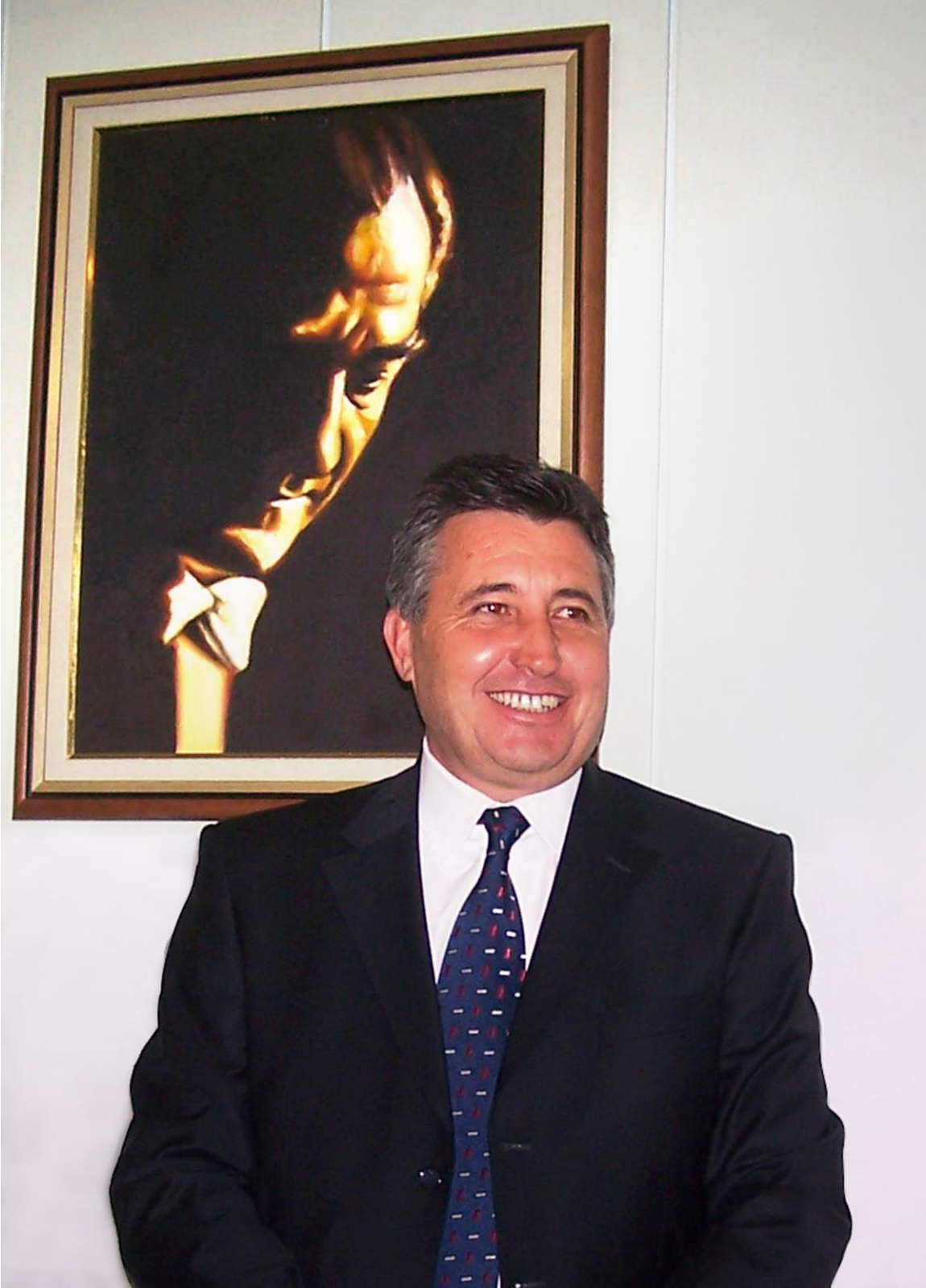
Ergun ÖZGÜN Menderes Belediye Başkanı