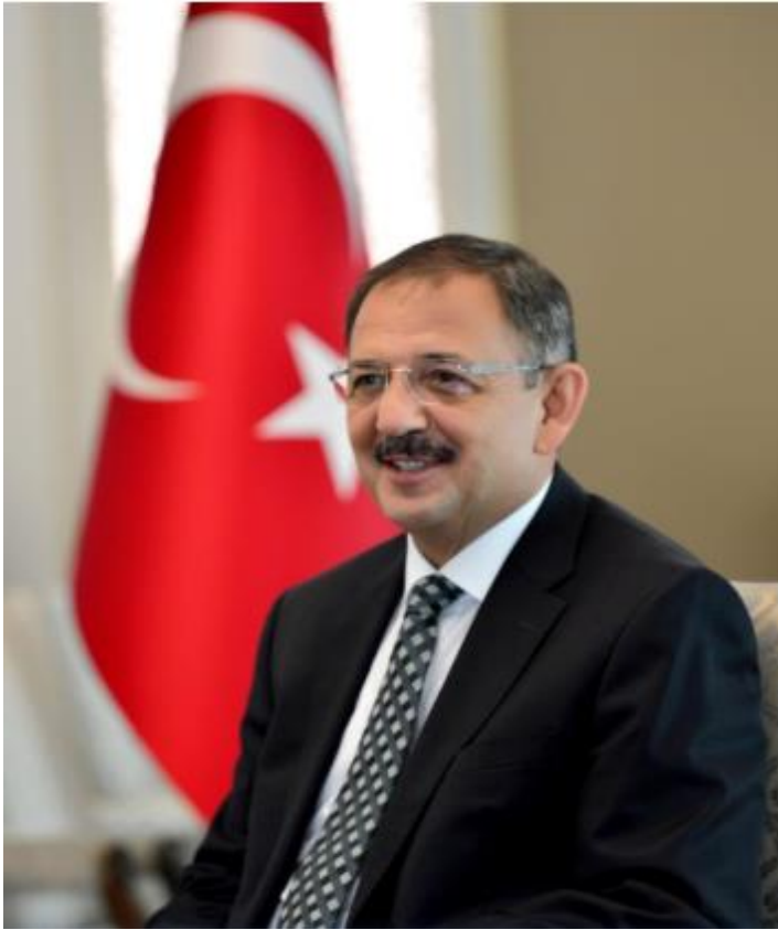
Mehmet ÖZHASEKİ Çevre, Şehircilik ve İklim Değişikliği Bakanı

Biriktirmiş olduğu tecrübesiyle ülkemizin en köklü kurumlarından olan Tapu ve Kadastro Genel Müdürlüğümüz taşınmazlara ilişkin mülkiyet bilgilerini devlet güvencesi altında muhafaza etme, güncelleme, taşınmazlara yönelik politikalar belirleme ve yönetme konularında çok yakın geçmişte pek çok öncü ve önemli projeyi hayata geçirerek örnek bir kurum olduğunu ortaya koymuştur.