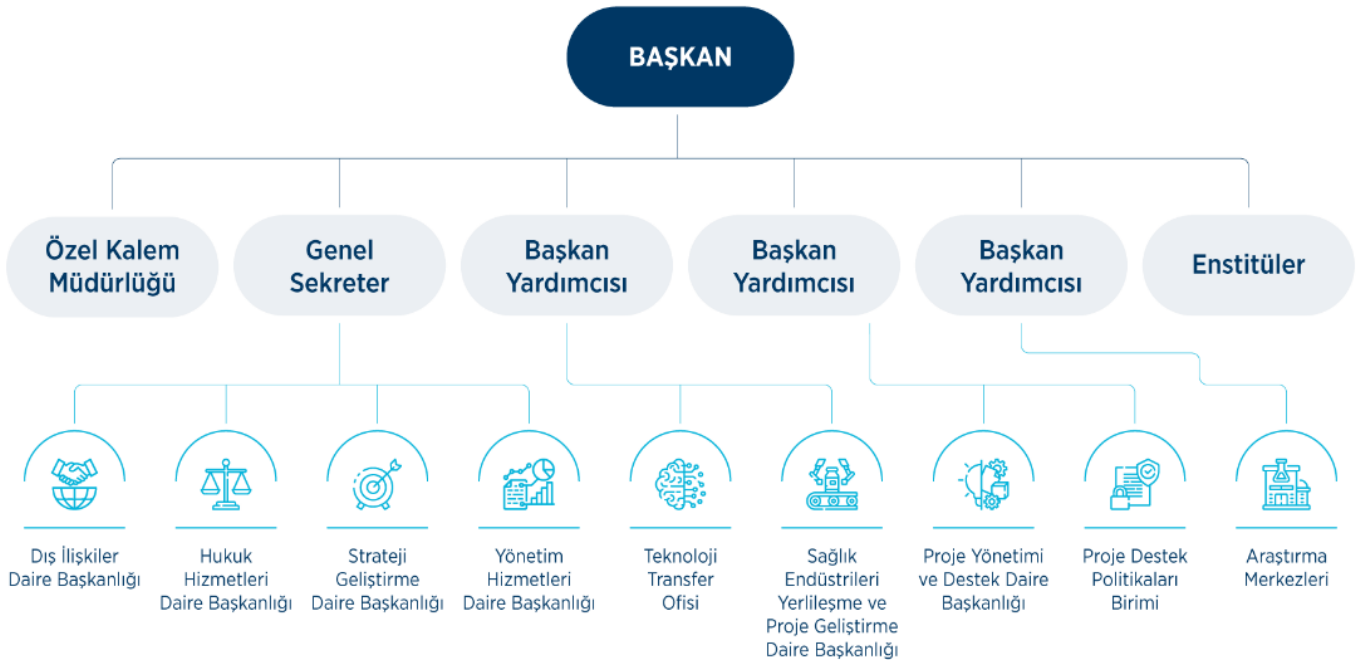
Tablo 1: Başkanlığımız Teşkilat Şeması

Türkiye Sağlık Enstitüleri Başkanlığı Teşkilat ve Görevleri Hakkındaki Yönetmeliğe göre Başkanlığımız organları, Yönetim Kurulu ve Başkanlıktan oluşmaktadır. Başkanlık; Başkan, Başkan Yardımcılıkları, Genel Sekreterlik, Enstitüler ile bunlara ait birimlerden oluşmaktadır. Başkanın teklifi üzerine Yönetim Kurulu tarafından belirlenen Başkanlığımız teşkilat şeması aşağıda yer almaktadır.