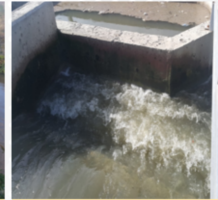
Atıksu Arıtma Tesisine giren “atıksu”