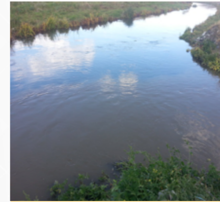
Arıtma Tesisi yapılmadan önceki zamanlarda Karasu nehrine deşarj edilen atıksuyun karışımı