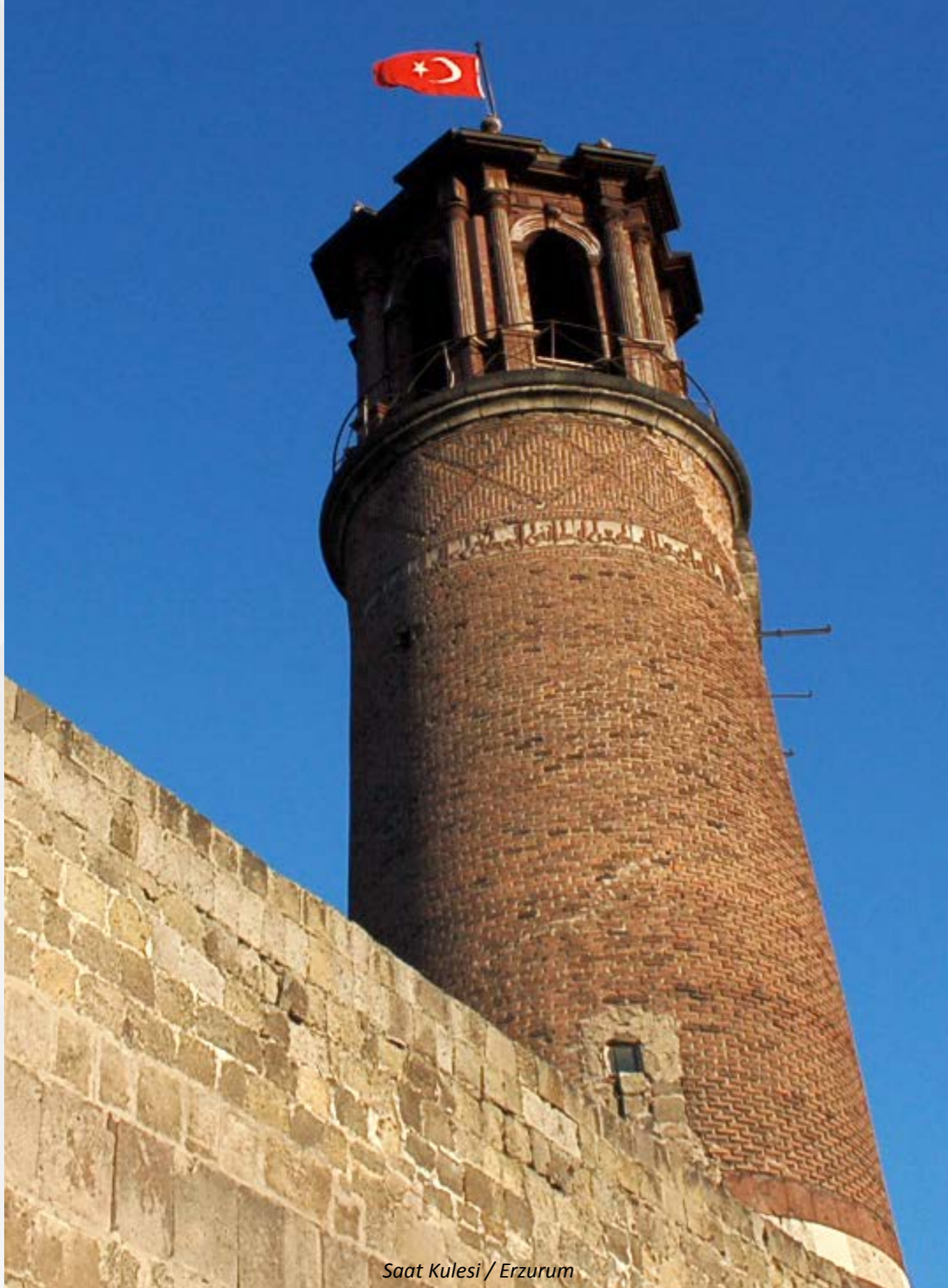
Saat Kulesi / Erzurum