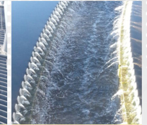
Atıksu Arıtma Tesisinde arıtıldıktan sonra Karasuya deşarj edilen “arıtılmış su”