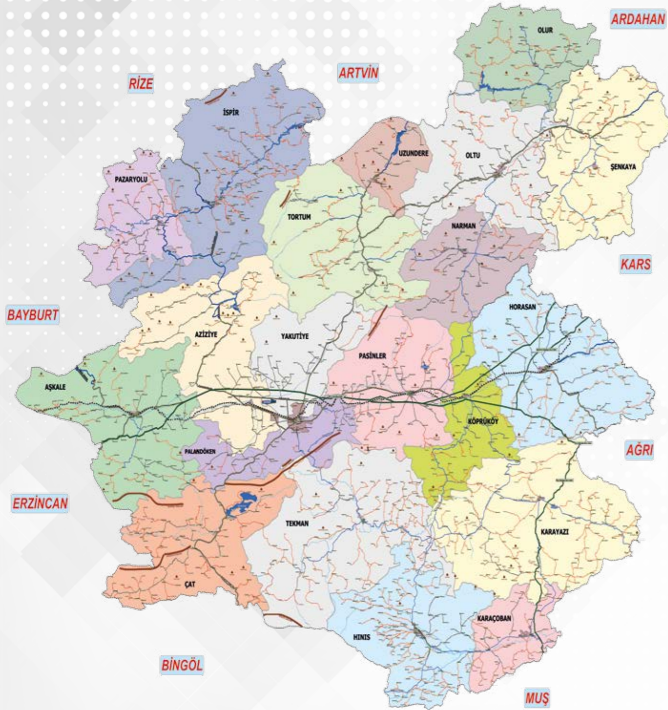
Erzurum İl Haritası