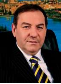
Belediye Başkanı Necmi KADIOĞLU

1954 yılında Gümüşhane’de doğdu. 1972 yılında Gümrük Müşaviri olarak başladığı iş hayatını çeşitli şirketlerde yöneticilik yaparak sürdürdü.