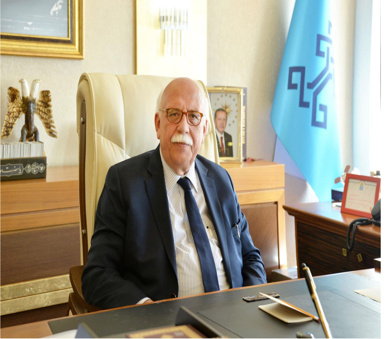
Nabi AVCI Kültür ve Turizm Bakanı