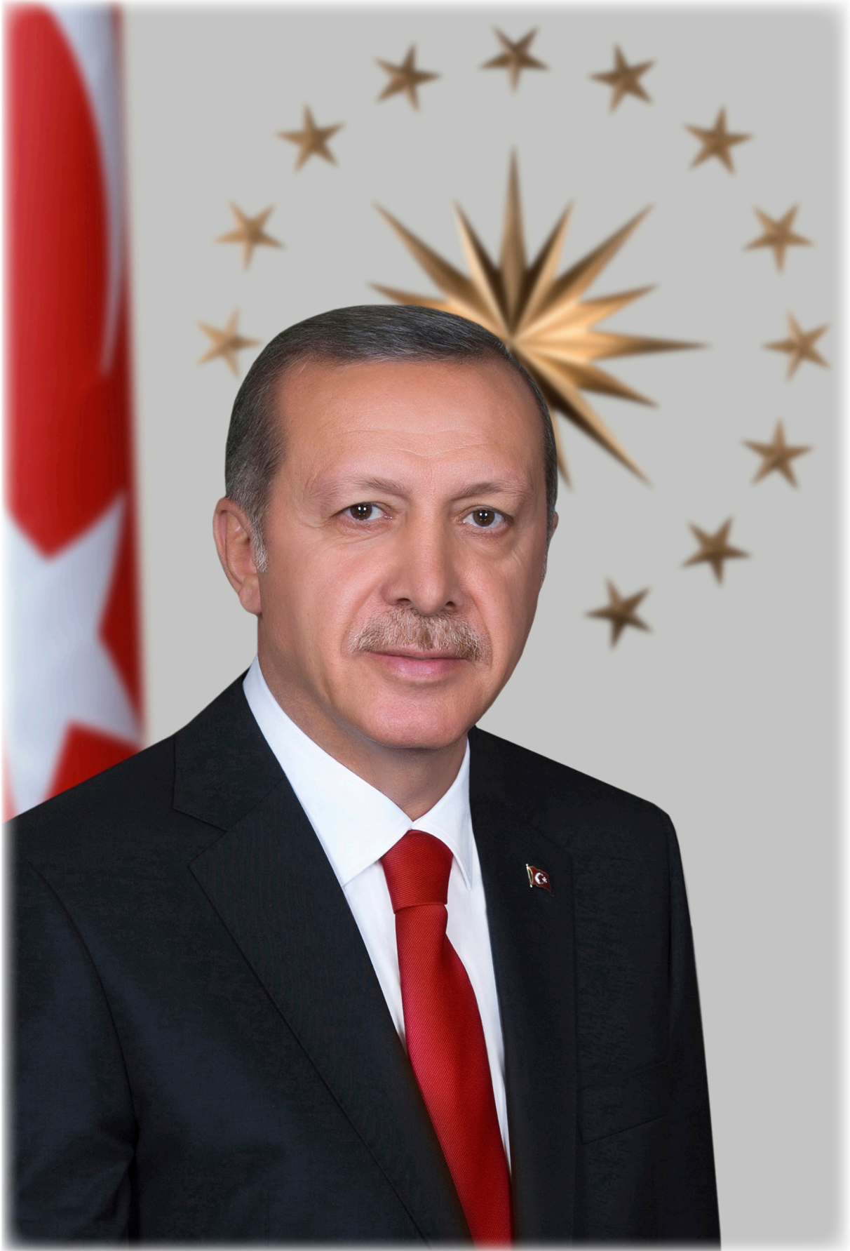
Recep Tayyip ERDOĞAN CUMHURBAŞKANI