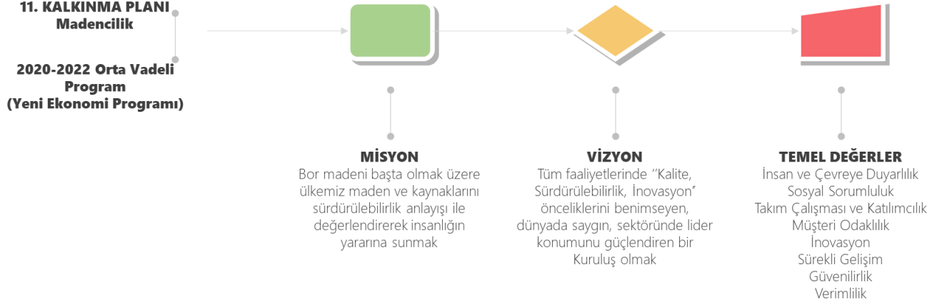
Şekil 2: Misyon, Vizyon ve Temel Değerler

2019-2023 Dönemi Stratejik Plan hazırlanırken başta Onbirinci Kalkınma Planı, Orta Vadeli Program (Yeni Ekonomi Programı) olmak üzere faaliyet alanımızla ilgili diğer dokümanlar da esas alınmıştır.