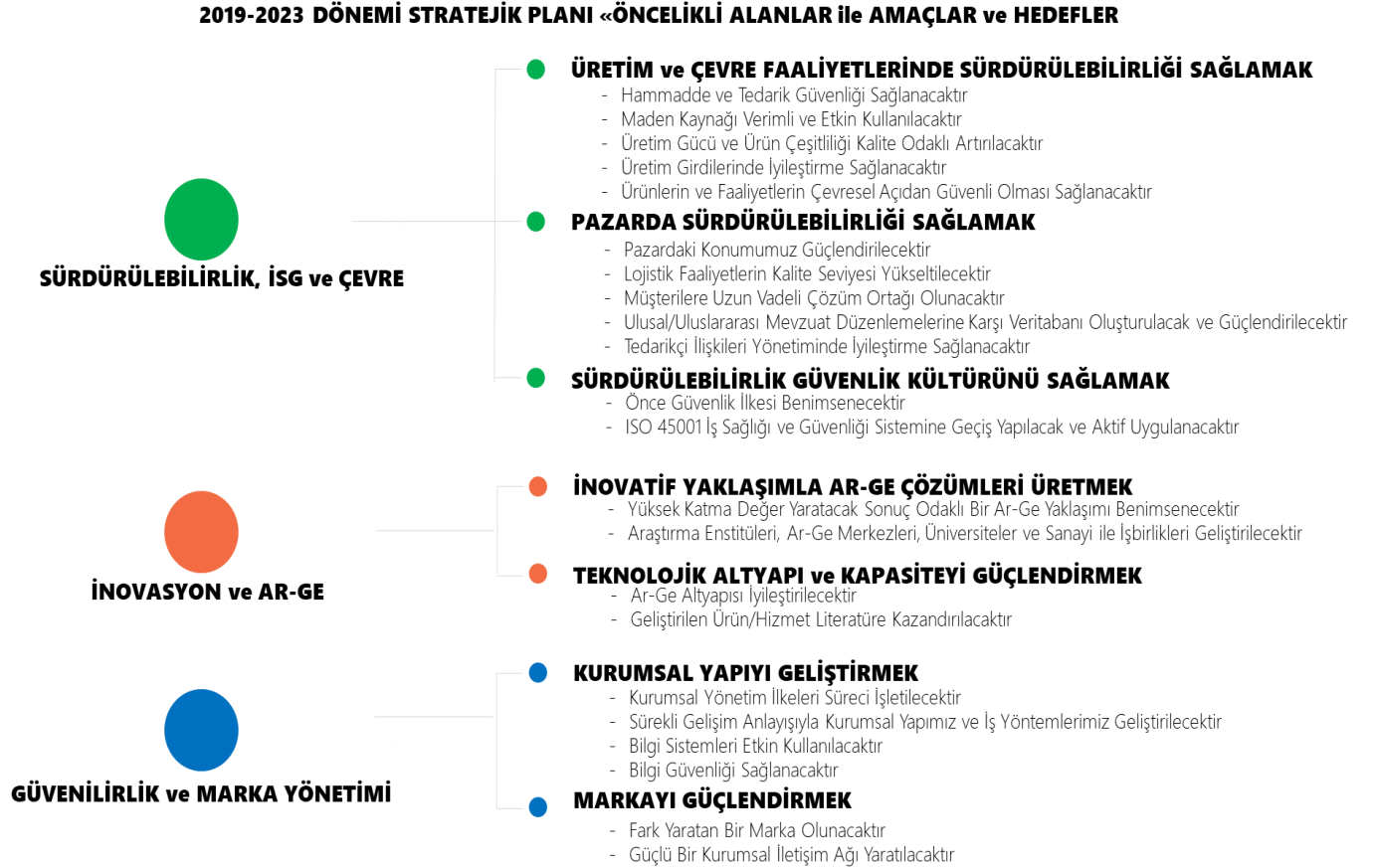
Şekil 3: Öncelikli Alanlar ve Amaçlar

Kuruluşumuz 2019-2023 Dönemi Stratejik Planı "Sürdürülebilirlik, İSG ve Çevre", "İnovasyon ve Ar-Ge" ve "Güvenilirlik ve Marka Yönetimi" olmak üzere 3 adet Öncelikli Alan üzerine kurulmuş olup; 7 Amaç ve 22 Hedef içermektedir.