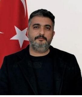
VOLKAN BAYRAKÇI İYİ PARTİ