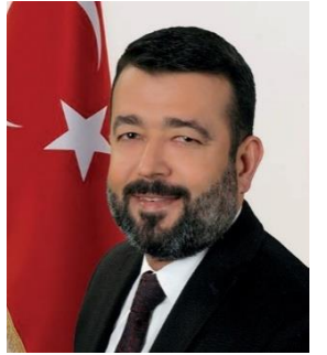
RUHİ GÜL SAADET PARTİSİ