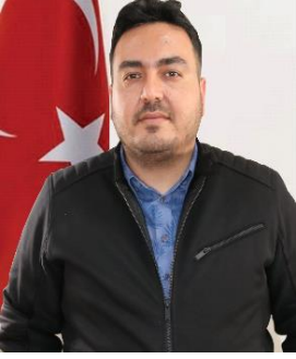
GÖLHAN COŞKUN MHP