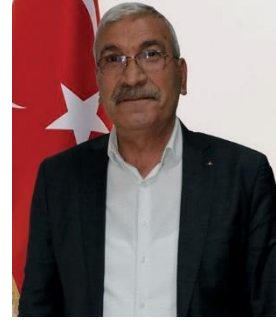
YUSUF EROĞLU MHP