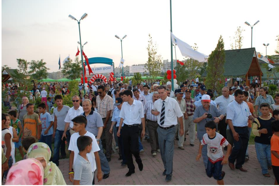
Tarsus Halkının Hizmetine Sunulan Parklardan sadece bir tanesi