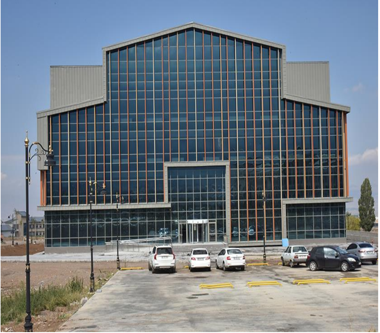
Resim 10 : Merkezi Kütüphane Binası

2017 yılında yatırım projesi kapsamına alınan 12.500 m 2 kapalı alan Merkezi Kütüphane Binasının inşaatı 2019 Yılı Ağustos Ayında tamamlanmış olup gerekli demirbaş-ekipmanın tamamlanmasıyla birlikte 2019 yıl sonunda hizmet vermeye başlamıştır.