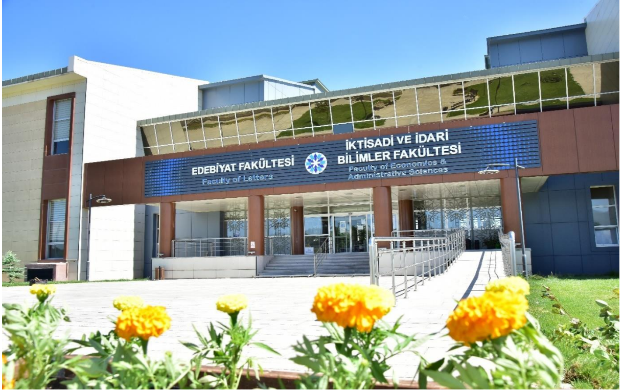
Resim 3: İktisadi ve İdari Bilimler Fakültesi ile Edebiyat Fakültesi

Ardından İktisadi ve İdari Bilimler Fakültesi ile Edebiyat Fakültesine hizmet verecek olan 19.581 m 2 'lik İktisadi ve İdari Bilimler Fakülte binası tamamlanmış olup fakültelerin öğrencileri bu binada eğitimlerini sürdürmektedirler.