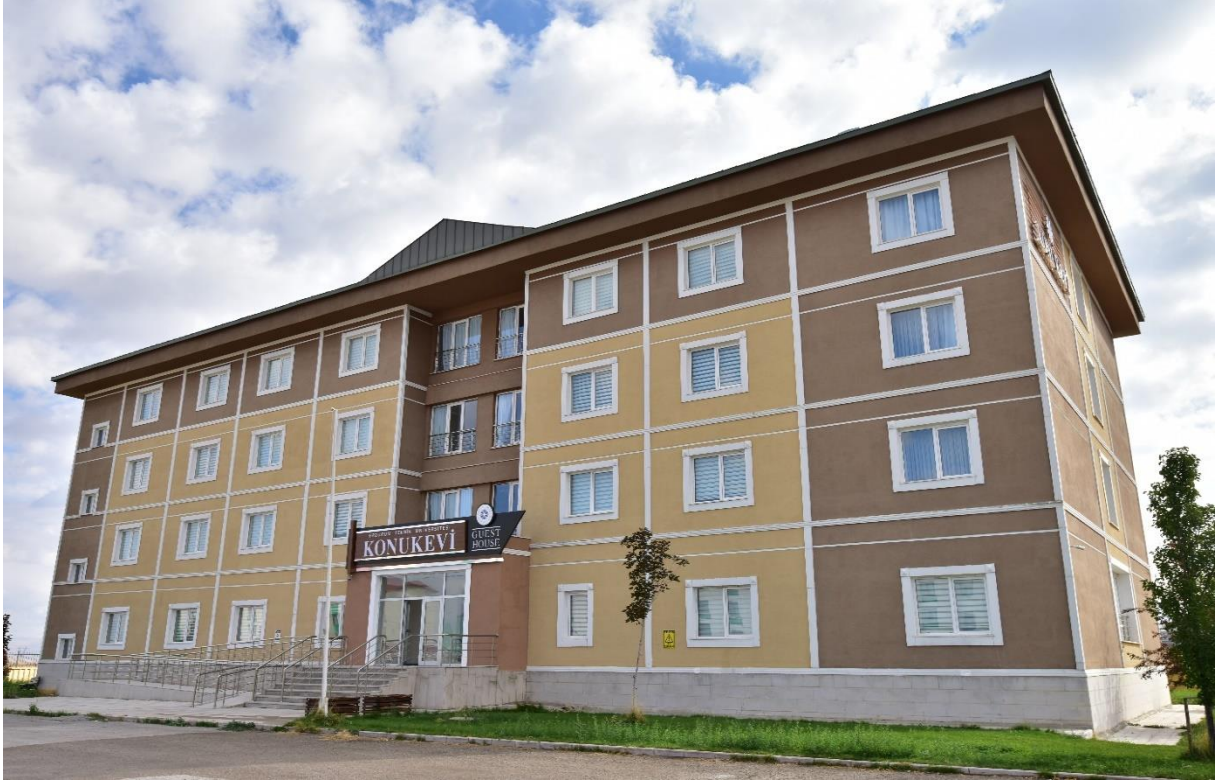
Resim 6: Konukevi