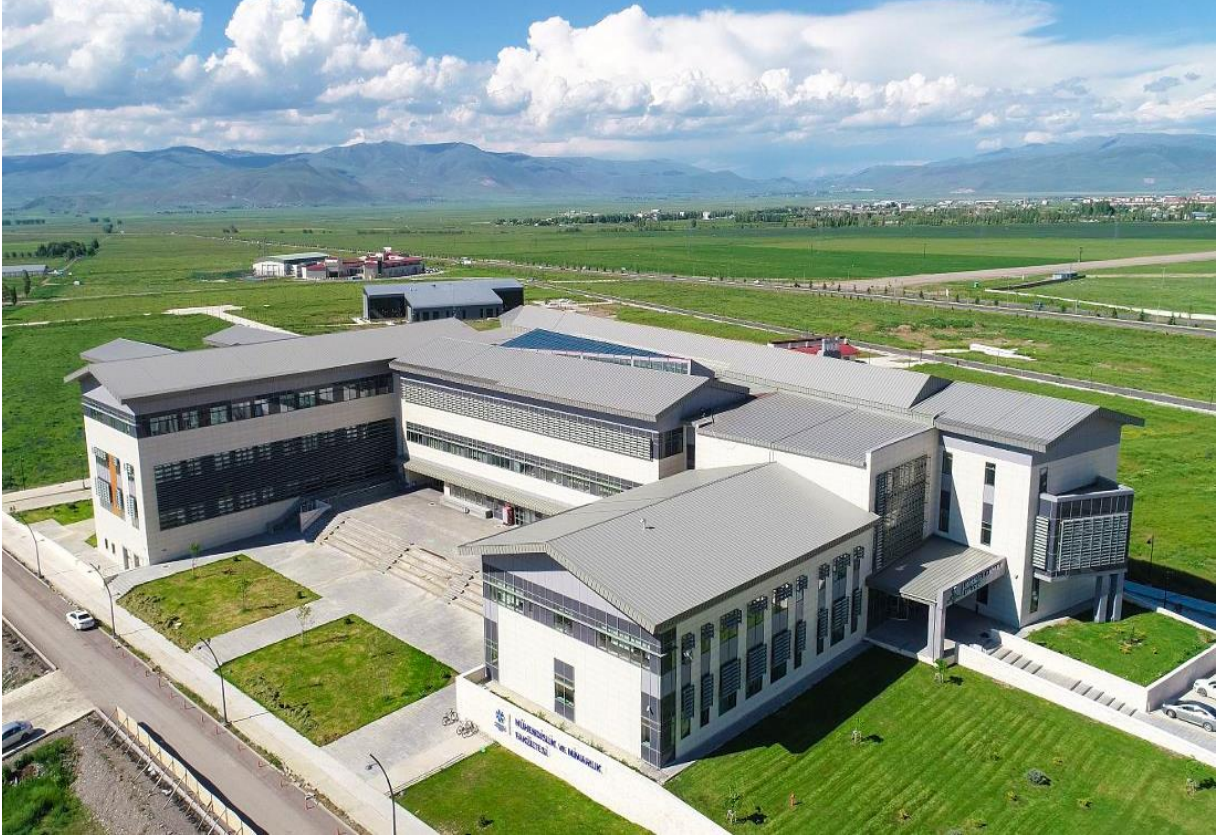
Resim 4: Mühendislik ve Mimarlık Fakültesi

Yapımı tamamlanan 25.245 m 2 'lik Mühendislik ve Mimarlık Fakültesi 2017 yılı içerisinde hizmete açılmıştır.