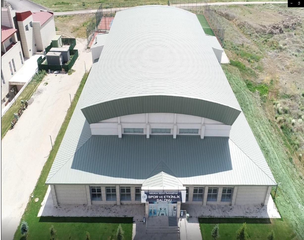
Resim:2 Kapalı Spor Salonu

Spor salonu olarak kullanılmak üzere yapılan 3.178 m 2 'lik ek derslik binası 2017 yıl sonu itibariyle kapalı spor salonuna dönüştürülmüştür.