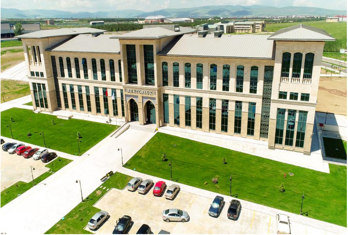
Resim 5: Rektörlük Binası

İş Bankası tarafından üniversitemize bağışlanan 152 öğrenci kapasiteli kız öğrenci yurdumuz 2018-2019 Eğitim-Öğretim Dönemi sonuna kadar aktif olarak hizmet etmiş olup öğrencilerimizin barınma ve sosyal yaşam ihtiyaçlarına cevap vermiştir. 2019 Yılı Eylül ayı itibariyle Konukevine dönüştürülmesi için Üniversitemizin Sosyal Tesisler Müdürlüğü bünyesinde tadilata alınan yurt binası, Nisan 2020 yılında tamamlanarak hizmete hazır hale getirilmiş olup, Covid-19 salgınının normalleşmesiyle birlikte hizmete açılması planlanmaktadır. 2017 yılı içerisinde 1500 kişilik Kredi ve Yurtlar Kurumu yurtları da kampüs alanımızda hizmete girmiş olup toplu taşıma güzergahlarıyla da öğrencilerin ulaşım imkanları kolaylaştırılmıştır.