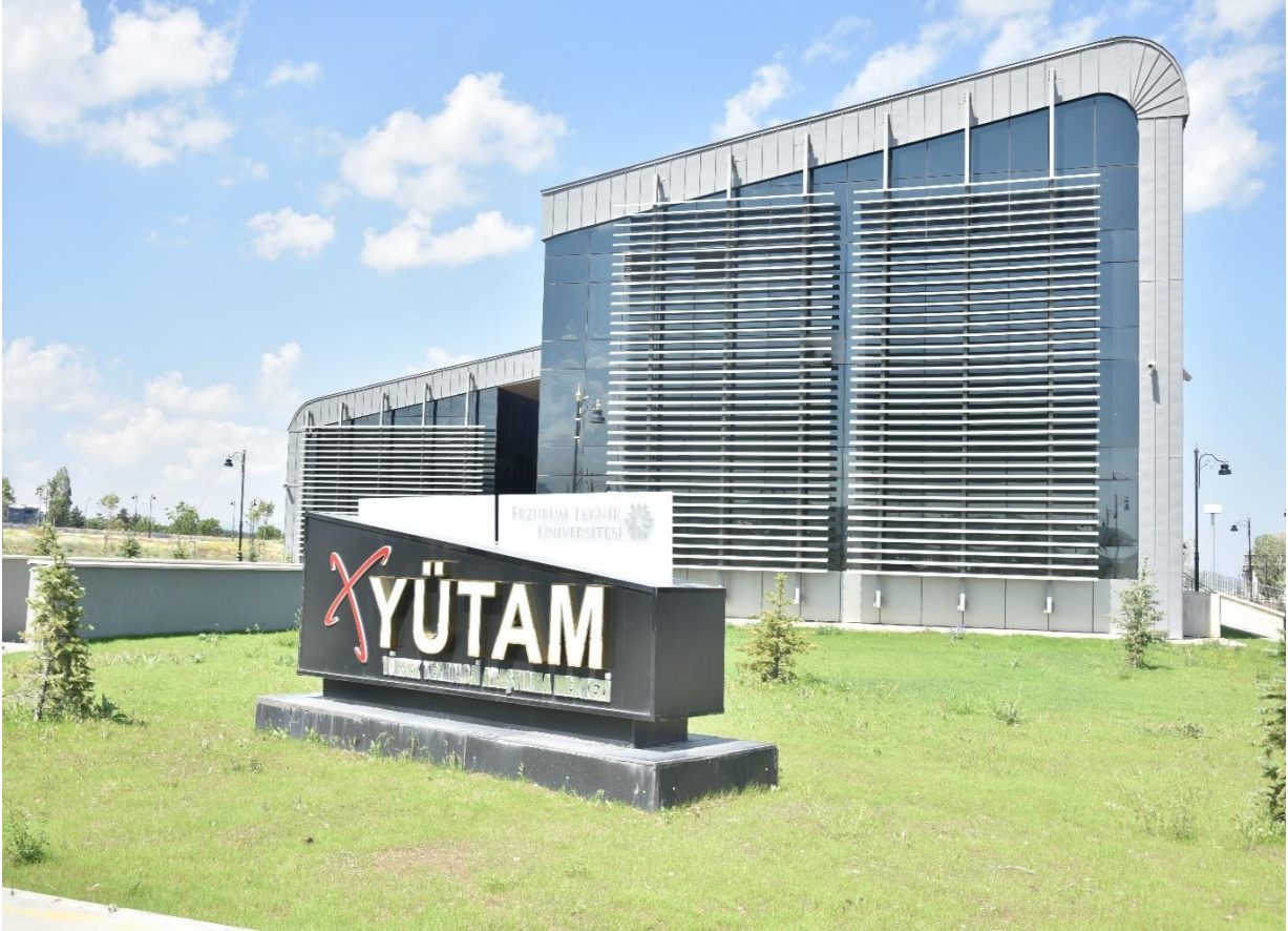
Resim 7: Yüksek Teknoloji Uygulama ve Araştırma Merkezi (YÜTAM)

Gerçekleştireceği nitelikli Ar-Ge çalışmaları ile ilimiz, bölgemiz ve ülkemizin 2023 yılı teknolojik hedeflerine ulaşmasında ciddi katkılar sunmayı kendine şiar edinen 4.700 m 2 'lik Yüksek Teknoloji Uygulama ve Araştırma Merkezi (YÜTAM) 2017 yılı içerisinde tamamlanarak hizmete açılmıştır.