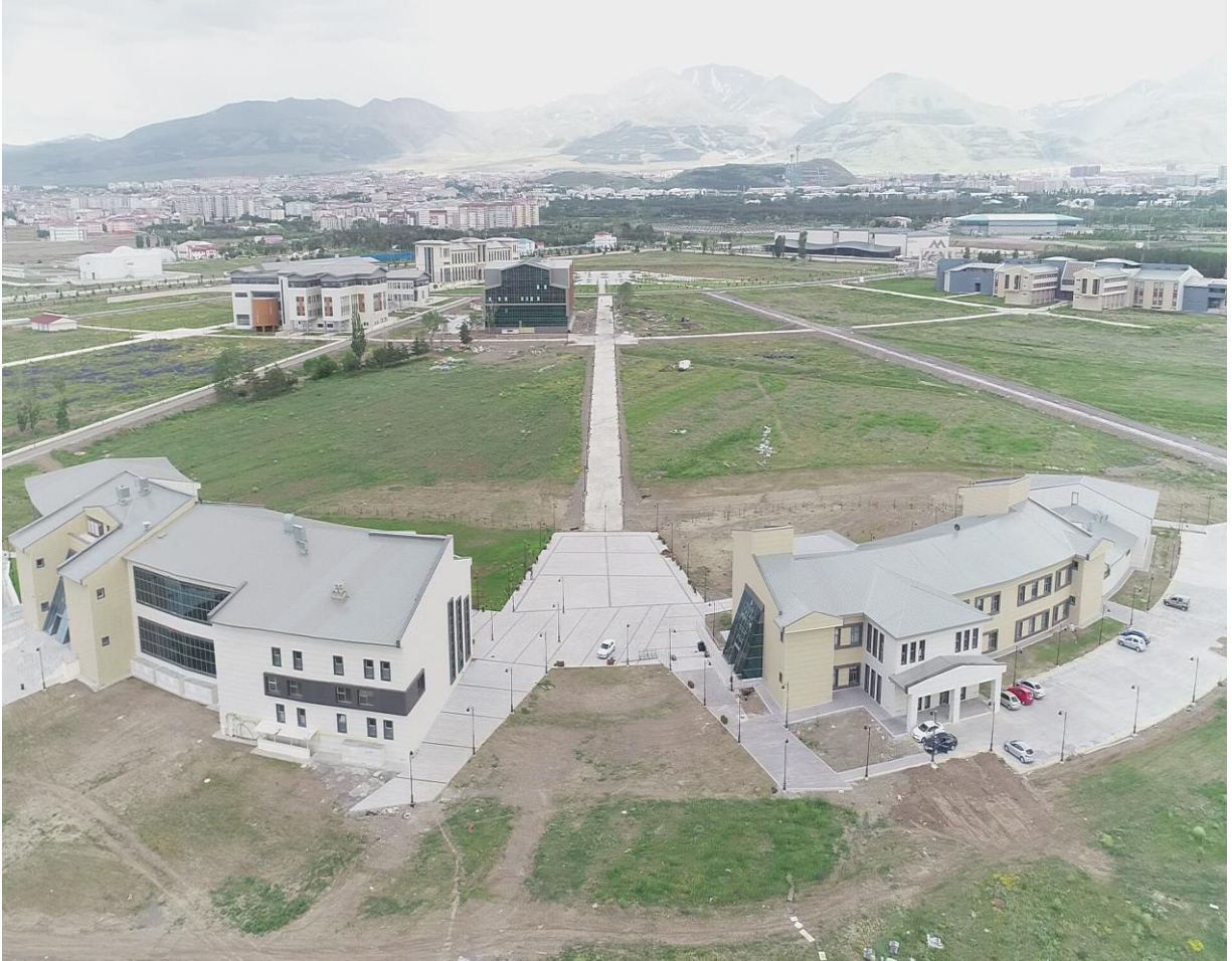
Resim 8 : I.ve II. Etap Öğrenci Yaşam Merkezi

2016 yılında temeli atılan Öğrenci Yaşam Merkezinin ilk etabı olan merkezi yemekhane kısmı tamamlanarak hizmet vermeye devam etmektedir. Devam eden süreçte öğrenci çarşısı ve sosyal yaşam donatıları ile hızla gelişecek olan Öğrenci Yaşam Merkezinin diğer kısımların yapımı da 2019 yılında tamamlanarak hizmete açılmıştır. Ayrıca 2019 yıl sonu itibarıyla yapımı tamamlanan 16 lojman ile birlikte toplam 64 lojman tahsis edilmiştir. Üniversitemiz içerisinde 10.500 metre bisiklet, yürüyüş ve araç yolu alt yapısı ve ışıklandırması tamamlanarak ulaşım ihtiyaçlarına cevap verilmiştir.