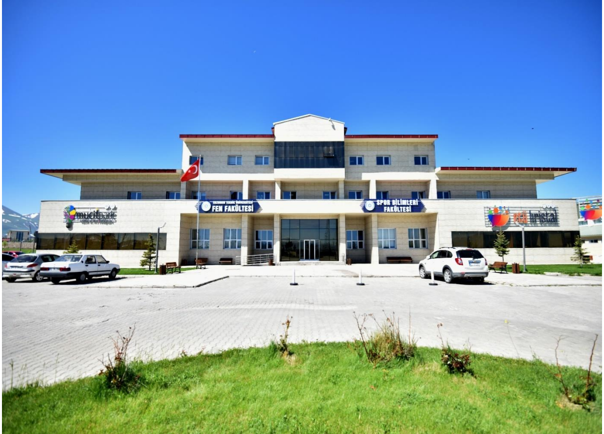
Resim:1 Fen Fakültesi ve Spor Bilimleri Fakültesi

İlk olarak 6250 m 2 ’lik merkezi derslikler binasının tamamlanması ile öğrencilerimizin eğitim standartları ve sosyal donatıları için önemli bir adım atılmıştır. Bahse konu merkezi derslikler binası 2017 yılı sonu itibariyle Fen Fakültesi ve Spor Bilimleri Fakültesi olarak hizmet vermeye başlamıştır.