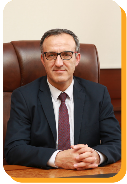
Prof. Dr. Muhammet HEKİMOĞLU Yüksek Kurum Başkanı

Bu doğrultuda hazırlanan Yüksek Kurum 2019-2023 Stratejik Planı'nda yer alan amaç ve hedeflerin yerine getirilebilmesi, stratejik plan ile bütçe arasında bağ kurulması amacıyla; doğru ve güvenilir bilgiye dayalı, mali saydamlığı ve hesap verebilirliği sağlayacak, çıktı ve sonuç odaklı bir anlayışla hazırlanan Atatürk Kültür, Dil ve Tarih Yüksek Kurumu 2023 Yılı Performans Programı'nı kamuoyunun bilgisine sunar, uygulanmasında tüm çalışanlara başarılar dilerim.