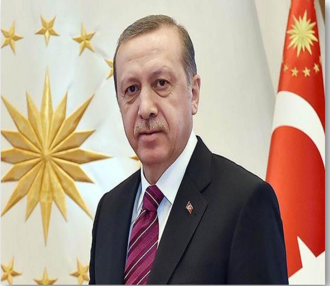
RECEP TAYYİP ERDOĞAN