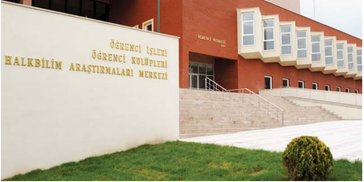
RESİM 5: ÖĞRENCİ İŞLERİ, ÖĞRENCİ KULÜPLERİ VE HALKBİLİM ARAŞTIRMALARI MERKEZİ'NDEN BİR GÖRÜNÜM

Üniversitemizin sunduğu en temel hizmet doğal olarak eğitim – öğretim hizmetidir. Üniversitemizde her türlü altyapısı tamamlanmış, çağdaş teknolojik olanaklara sahip, demokratik bir ortamda öğrenci öncelikli eğitim verilmekte; öğrenciler, uluslararası ölçütlerde katılımcı bir anlayışla sosyal ve kültürel etkinliklerin içinde yer almakta; kendilerini ifade etme olanağı bulmaktadır.