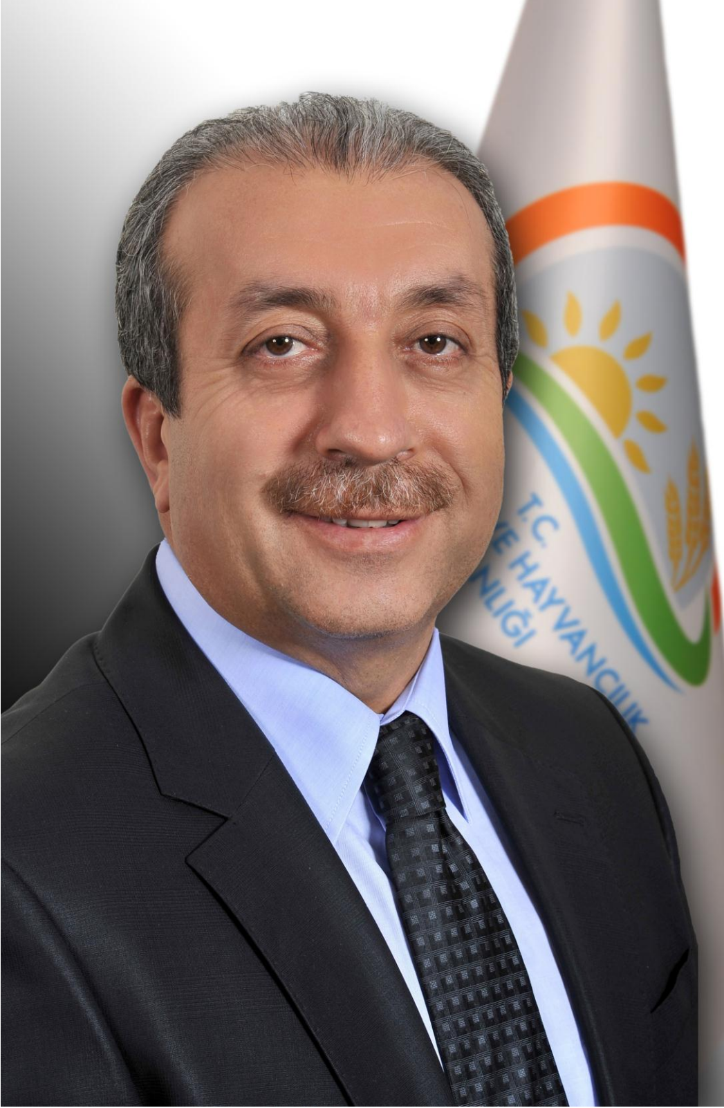
Mehmet Mehdi EKER Gıda Tarım ve Hayvancılık Bakanı