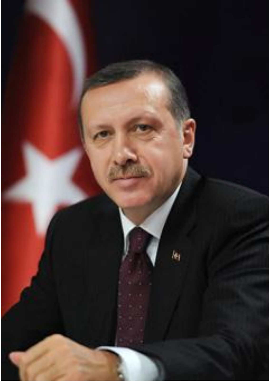
Recep Tayyip ERDOĞAN Başbakan