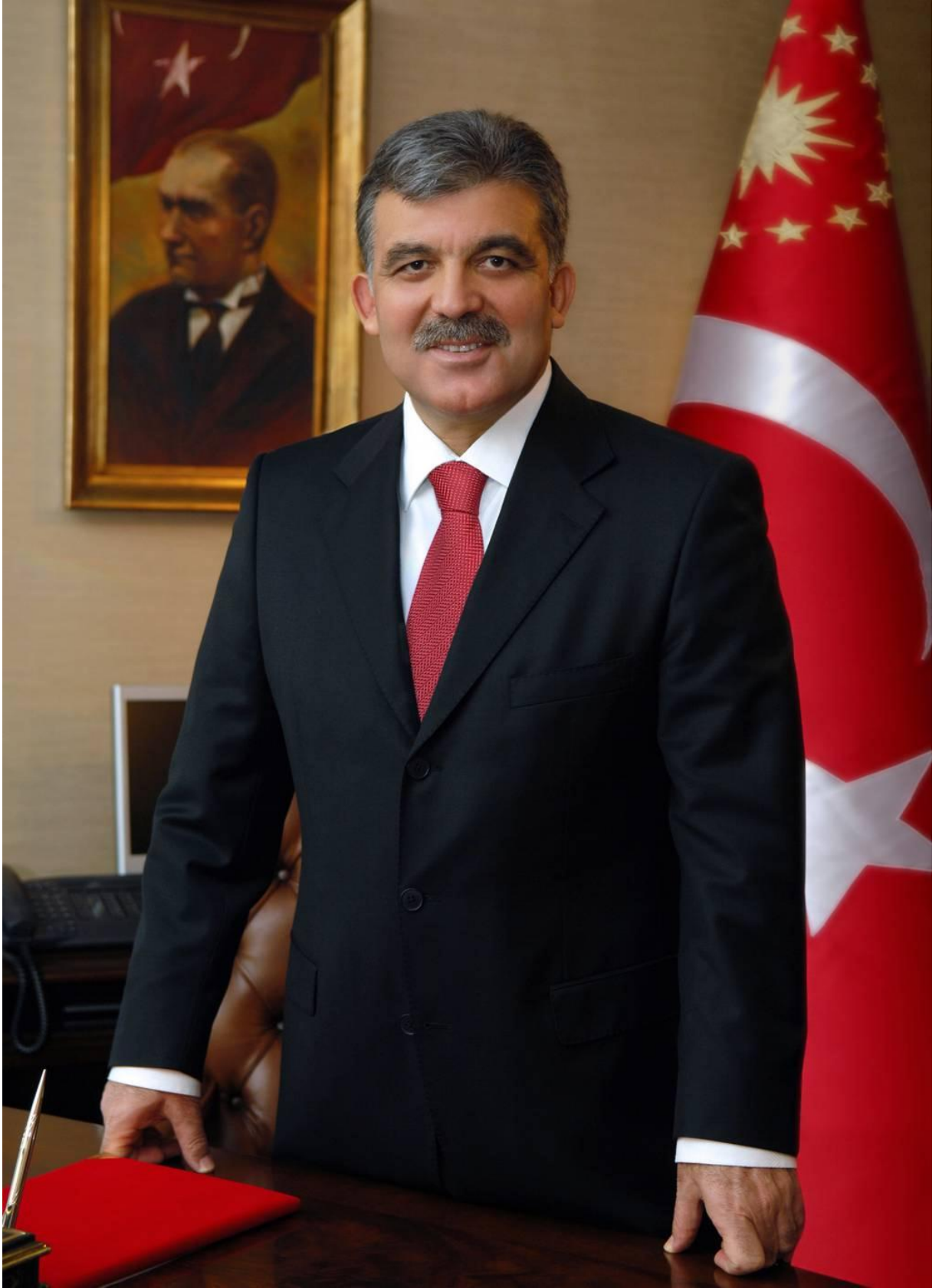
Abdullah GÜL Cumhurbaşkanı