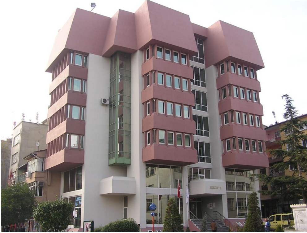
Orhangazi Belediyesi Ana Hizmet Binası