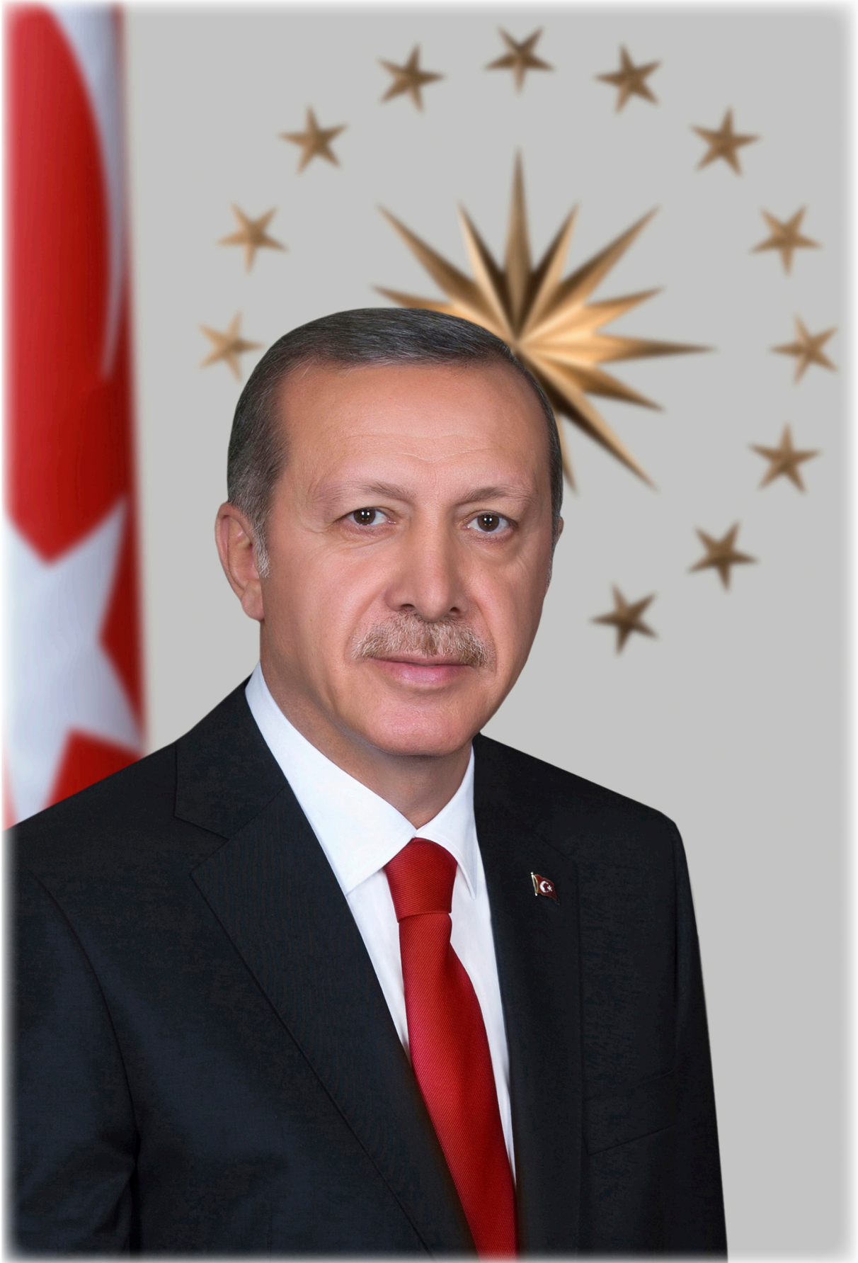
RECEP TAYYİP ERDOĞAN CUMHURBAŞKANI