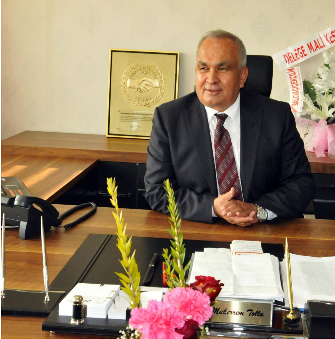
MÜKERREM TOLLU BELEDİYE BAŞKANI