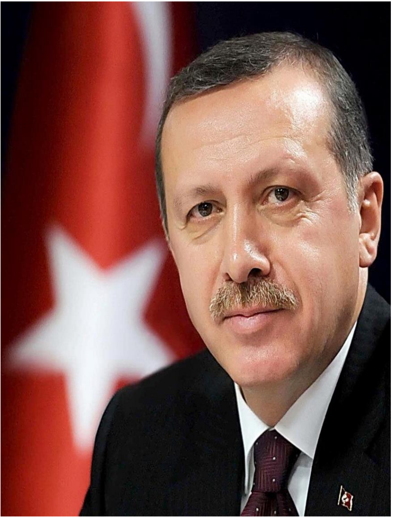
RECEP TAYYİP ERDOĞAN CUMHURBAŞKANI