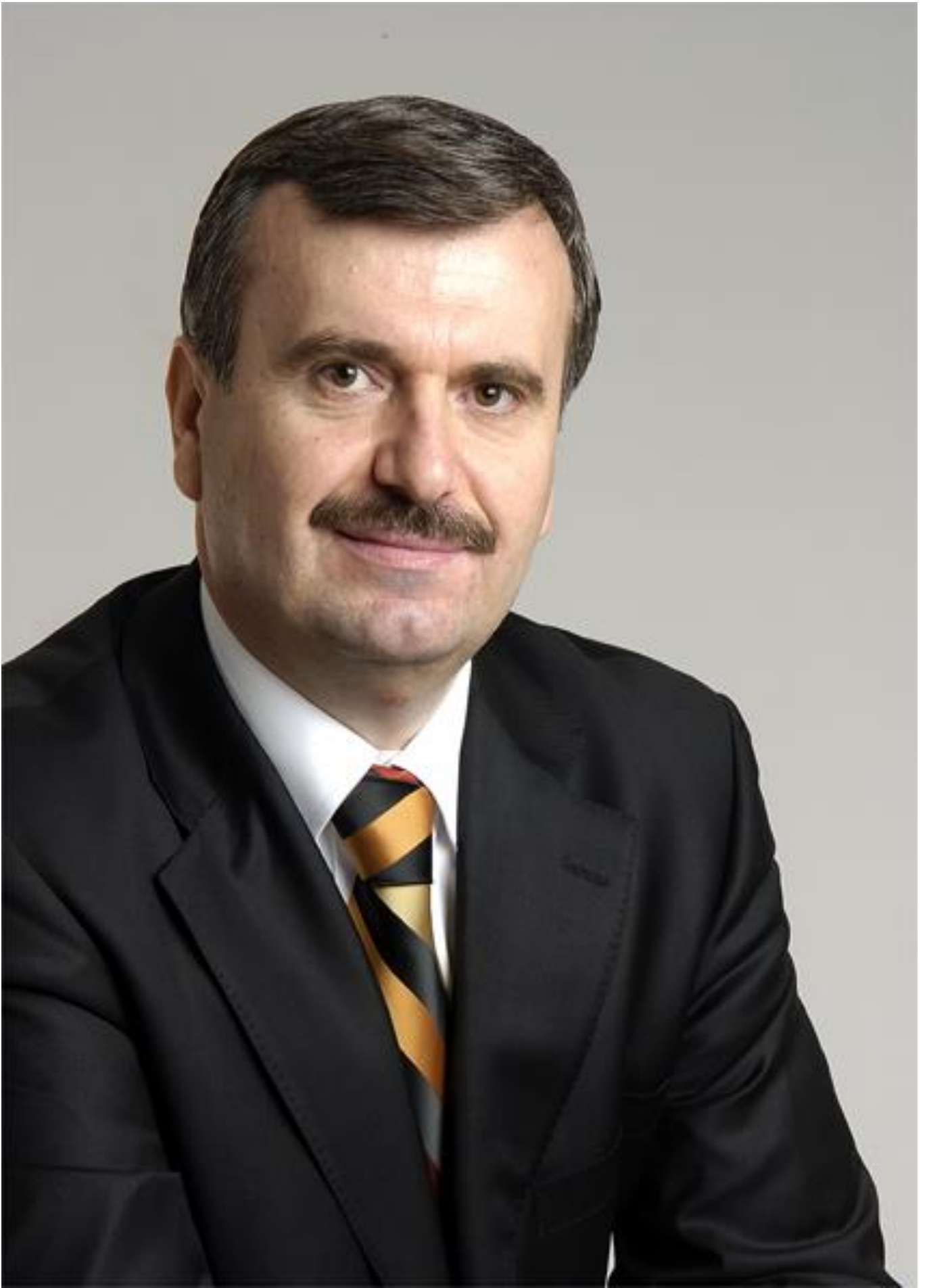
TAHİR AKYÜREK BÜYÜKŞEHİR BELEDİYE BAŞKANI