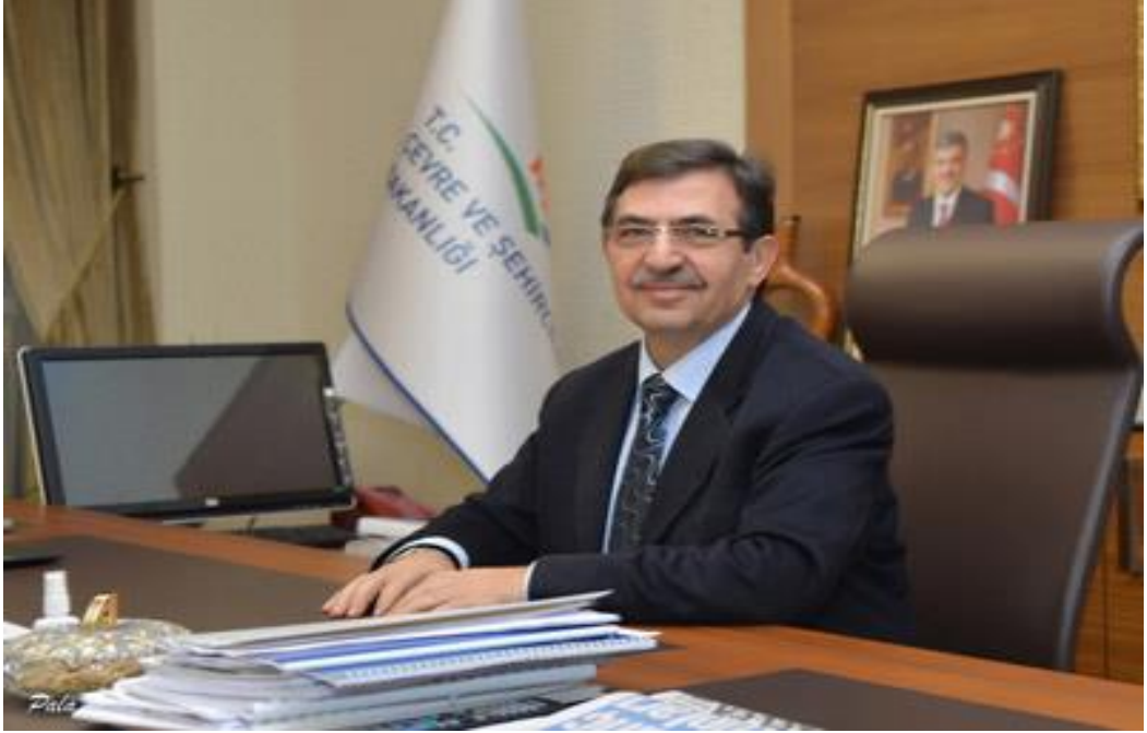
İdris GÜLLÜCE Çevre ve Şehircilik Bakanı