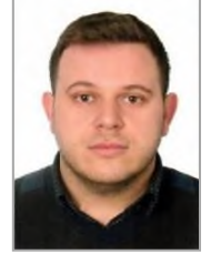
Samet AYVAZ Adalet ve Kalkınma Partisi