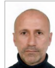
Hasan ŞENOL Cumhuriyet Halk Partisi