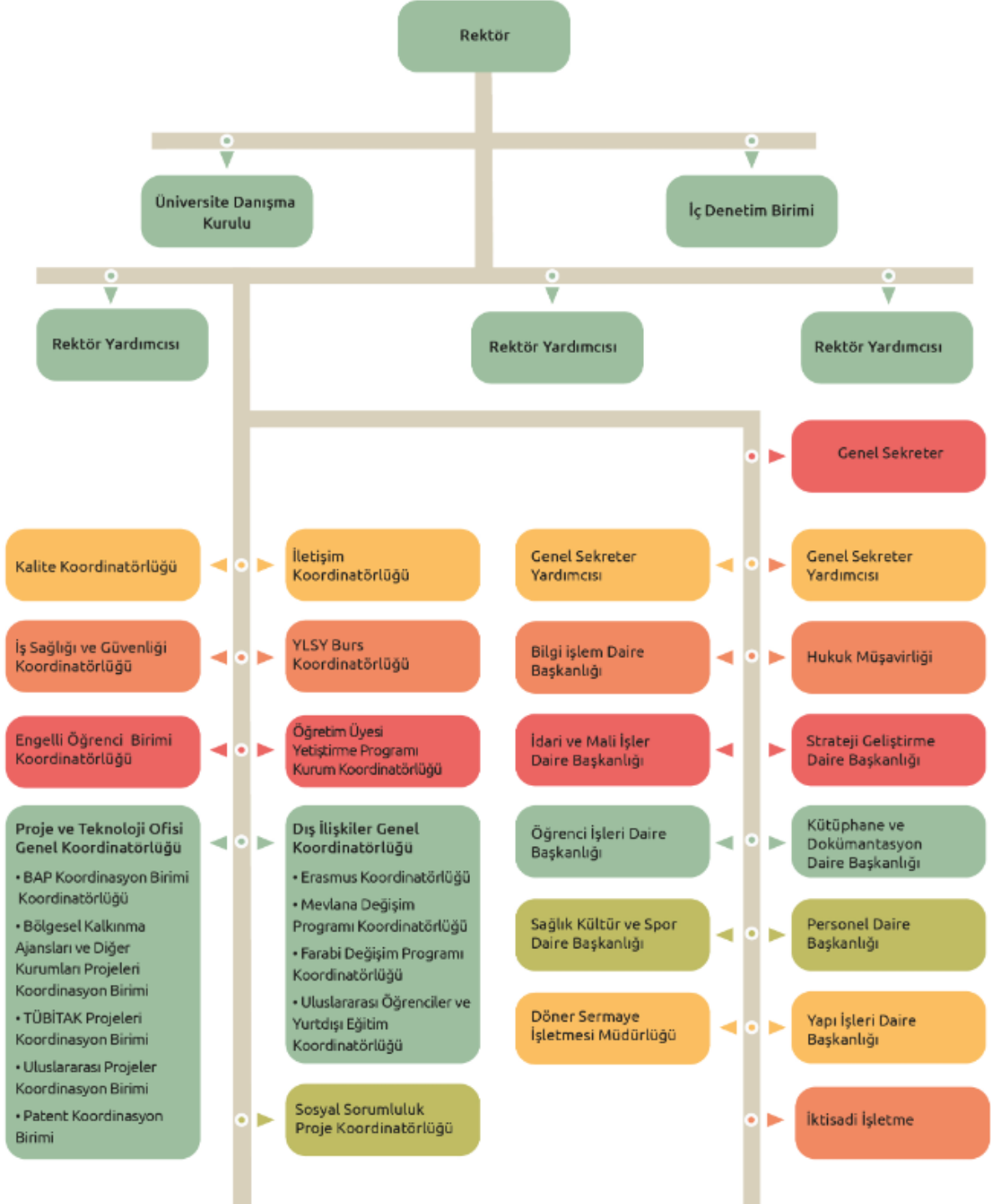
Şekil 2. İdari Teşkilat Şeması