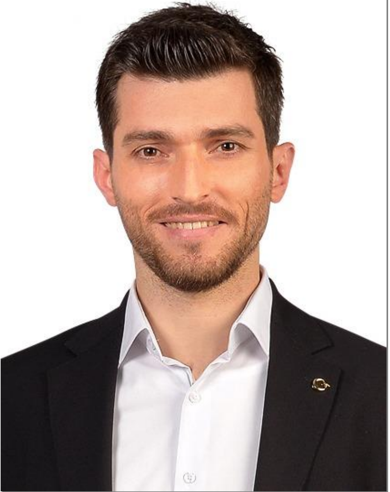
Ertuğrul KARAGÖL Belediye Başkanı