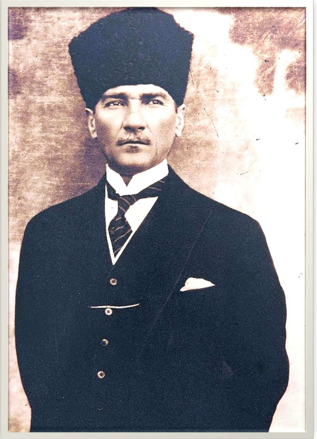
Mustafa Kemal ATATÜRK