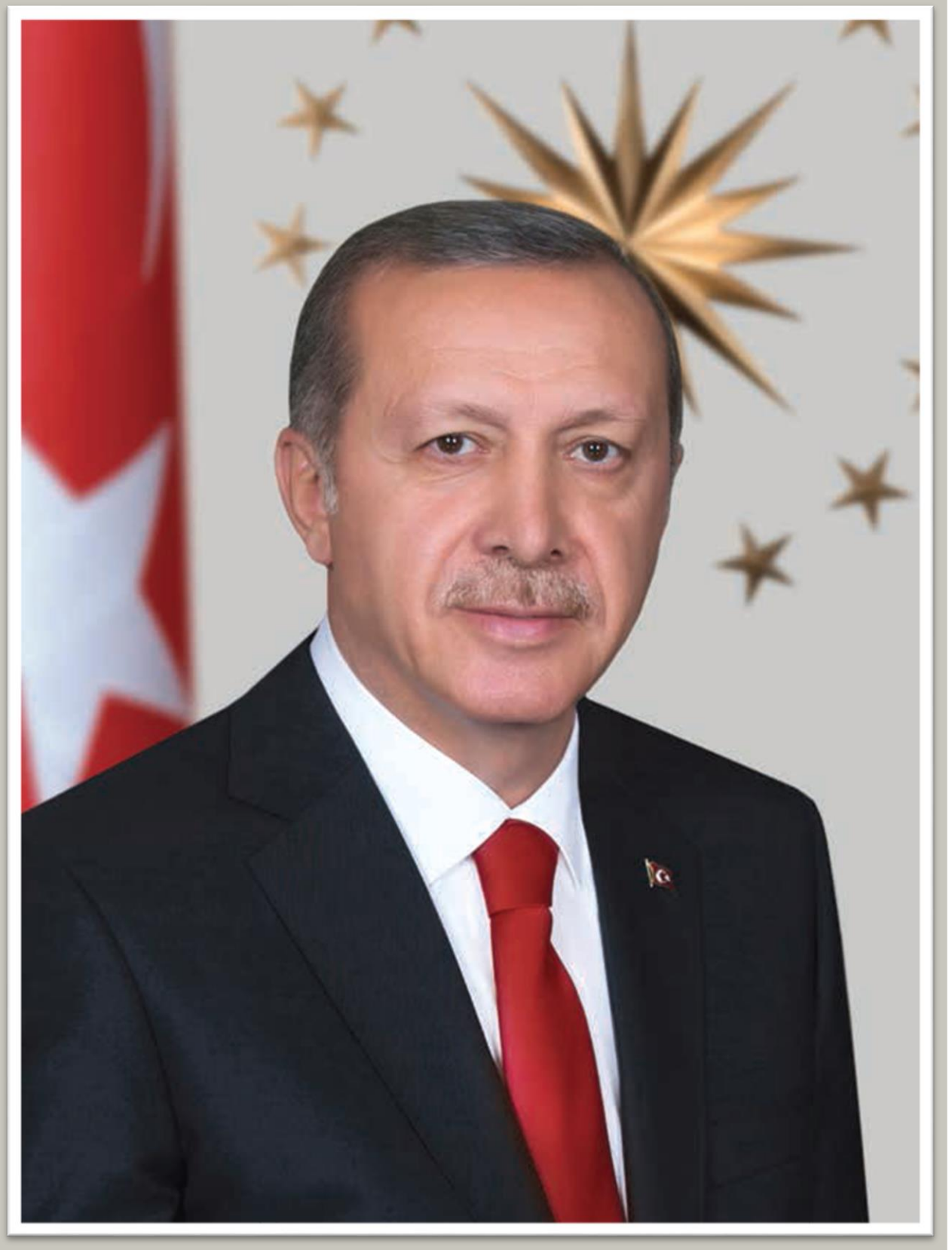
Recep Tayyip ERDOĞAN Cumhurbaşkanı