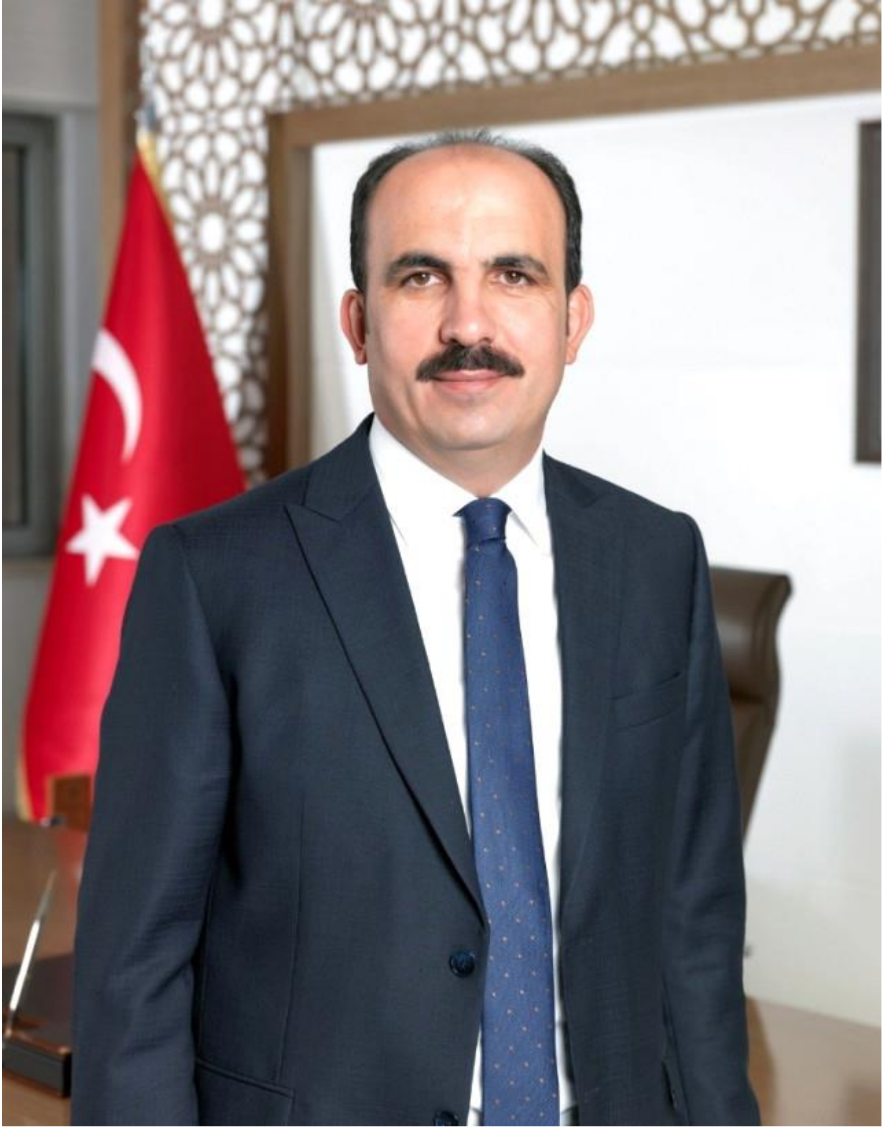
UĞUR İBRAHİM ALTAY BÜYÜKŞEHİR BELEDİYE BAŞKANI