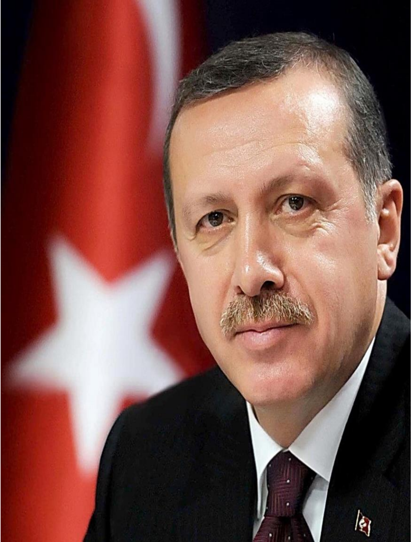
RECEP TAYYİP ERDOĞAN CUMHURBAŞKANI