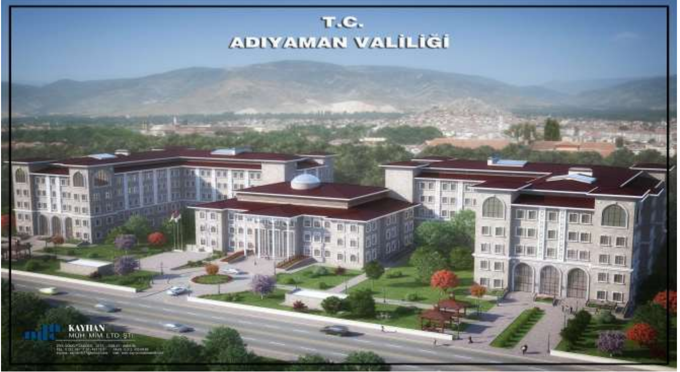
Adiyaman Valiliği Hükümet Konağı ve İl Özel İdare Binası

Adiyaman Valiliği Hükümet Konağı ile İl Özel İdaresi Hizmet Binasının yapımı işi 2015 yılında KDV hariç 48.288.840,24 TL'ye ihale edilerek yapımına başlanılmış olup, 2019 yılında bittirilmesi hedeflenmektedir.