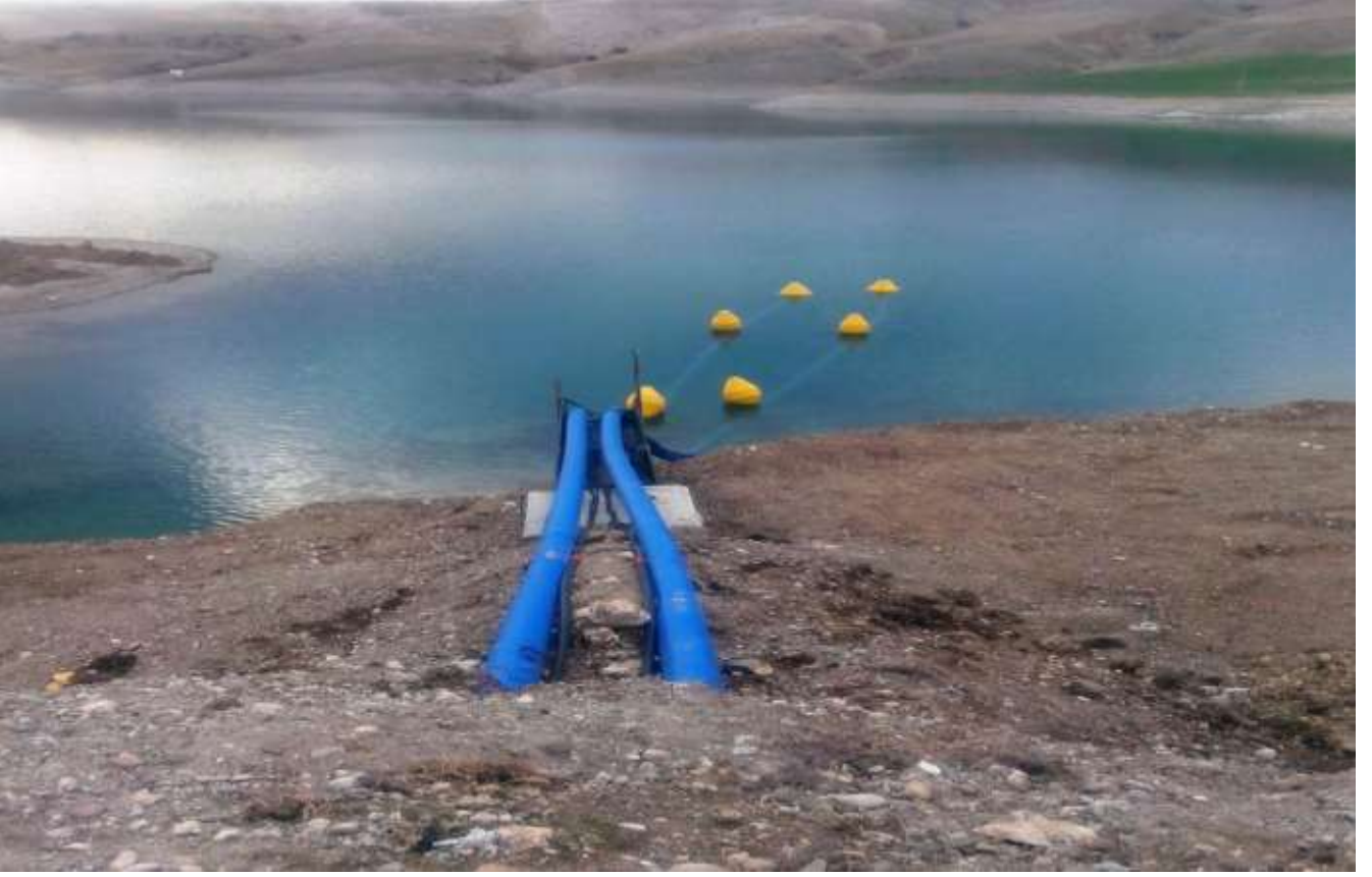
Kahta Oluklu İçme Suyu çalışmaları