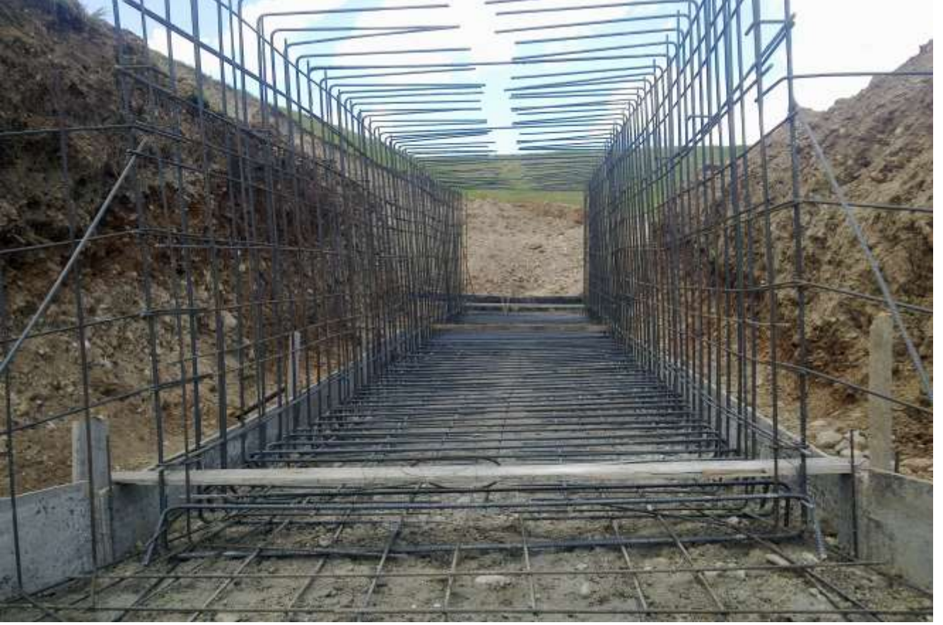
Menfez Yapımı Çalışması