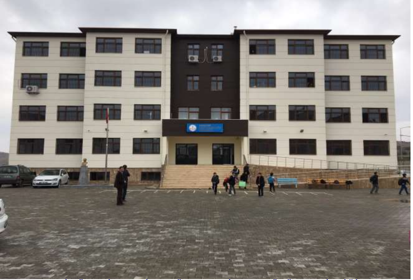
ADİYAMAN İL ÖZEL İDARESİ VE KÖYLERE HİZMET GÖTÜRME BİRLİĞİ TARAFINDAN MİLLİ EĞİTİM ADINA YAPILAN OKULLAR