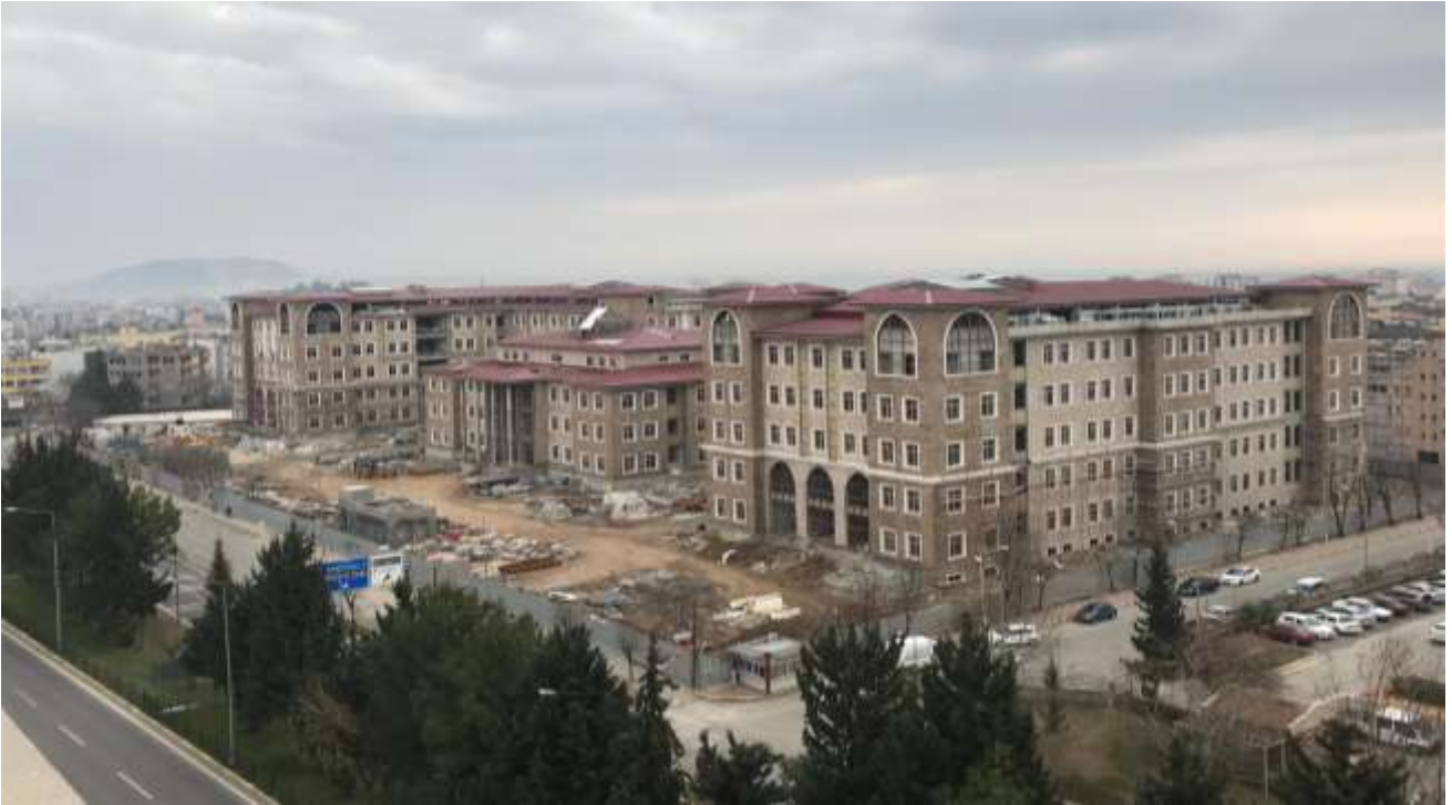
Merkez Hükümet konağı İnşaatı

Adiyaman Valiliği Hükümet Konağı ile İl Özel İdaresi Hizmet Binasının yapımı işi 2015 yılında KDV hariç 48.288.840,24 TL'ye ihale edilerek yapımına başlanılmış olup, 2019 yılında bittirilmesi hedeflenmektedir.