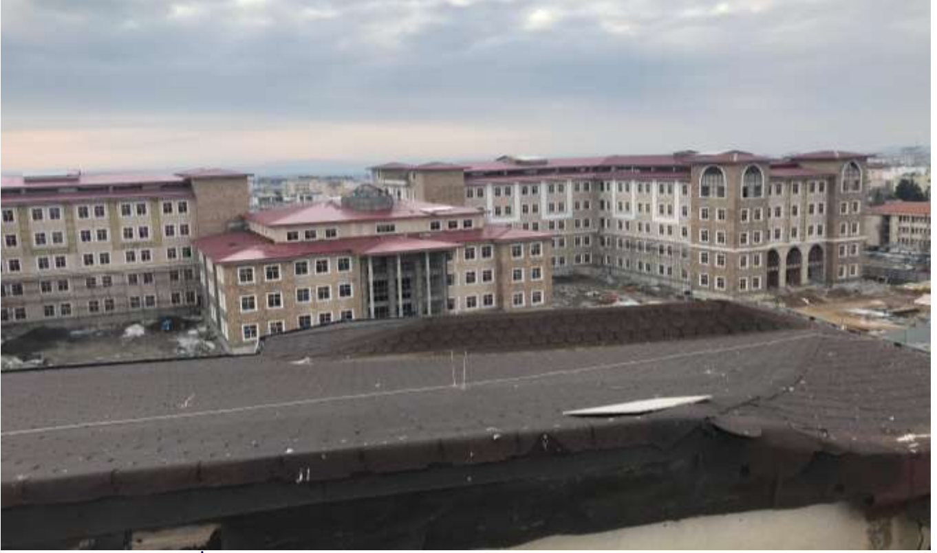
Merkez Hükümet konağı İnşaatı