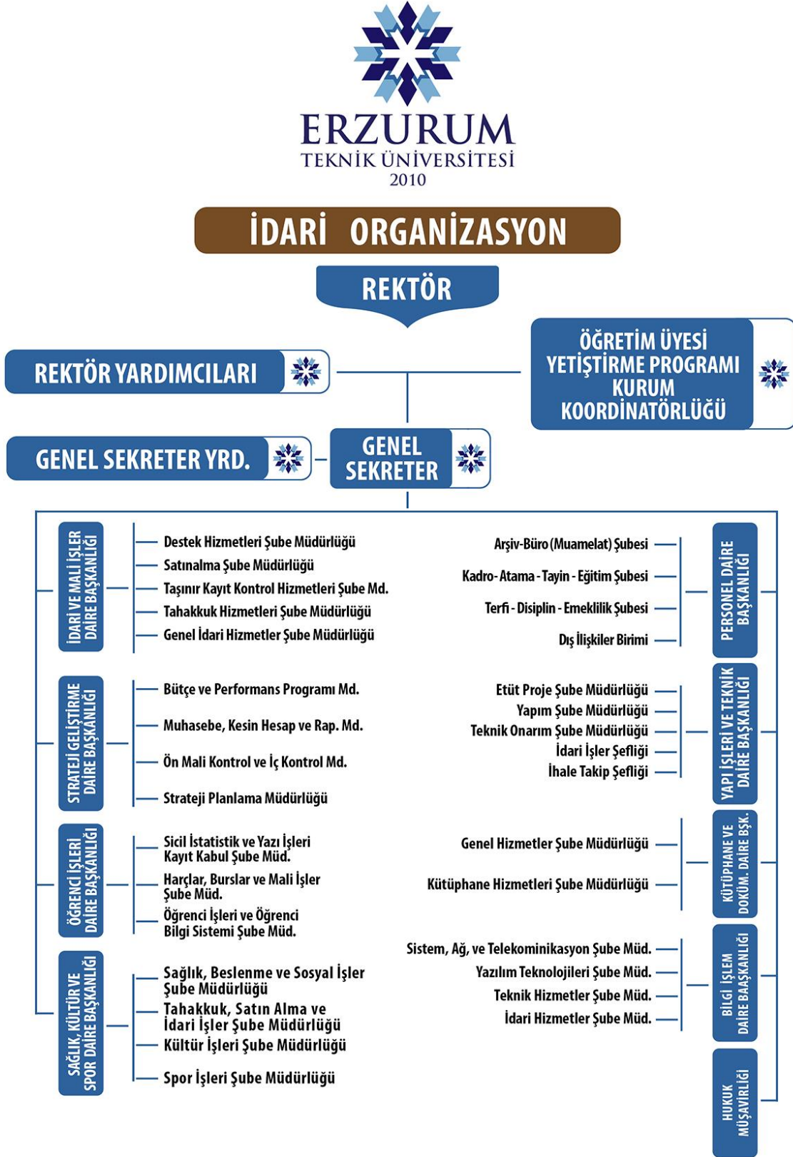
Şekil 2: Erzurum Teknik Üniversitesi Rektörlük Örgütü İdari Birimler Organizasyon Şeması