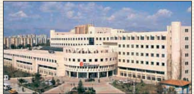
Antalya Vergi Dairesi Başkanlığı

Başkanlığın taşra teşkilatı, doğrudan mer-