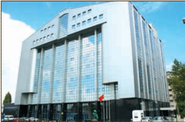
Gelir İdaresi Başkanlığı Bilgi İşlem Merkezi

nolojik gelişmelere uygun bir şekilde geliştirmek; bilişim faaliyetlerini yürütmek; idare ve mükelleflerce kullanılacak belge ve formlarla vergi beyannamelerini hazırlamak; taşra teşkilatının kuruluşu, görev ve çalışma esasları ile ilgili yönetmelik ve yönergeleri hazırlamak; iş ve işlemlerin koordinasyonunu ve uygulama birliğini sağlamak.