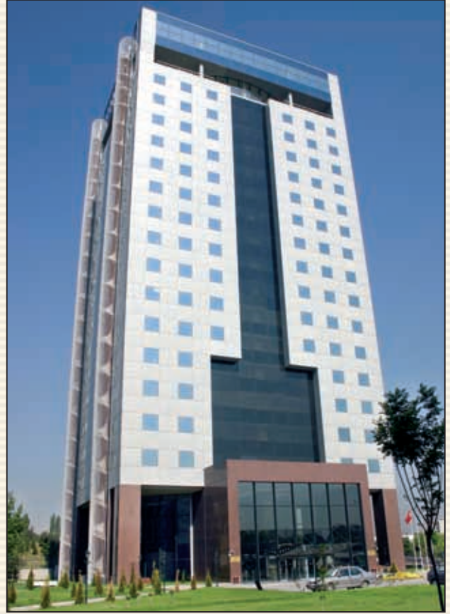
Gelir İdaresi Başkanlığı Merkez Hizmet Binası

Gelir İdaresi Başkanlığı, en üst amir olan başkan ve 5 başkan yardımcısı tarafından mevzuat hükümlerine ve Başkanlığın politika ve stratejilerine uygun olarak yönetilir. Başkan yardımcılarını kendilerine verilen yönetim görevlerinin yanı sıra vergi dairesi başkanlıklarının koordinasyonu ile görevlendirilebilir ve başkana karşı sorumludurlar.