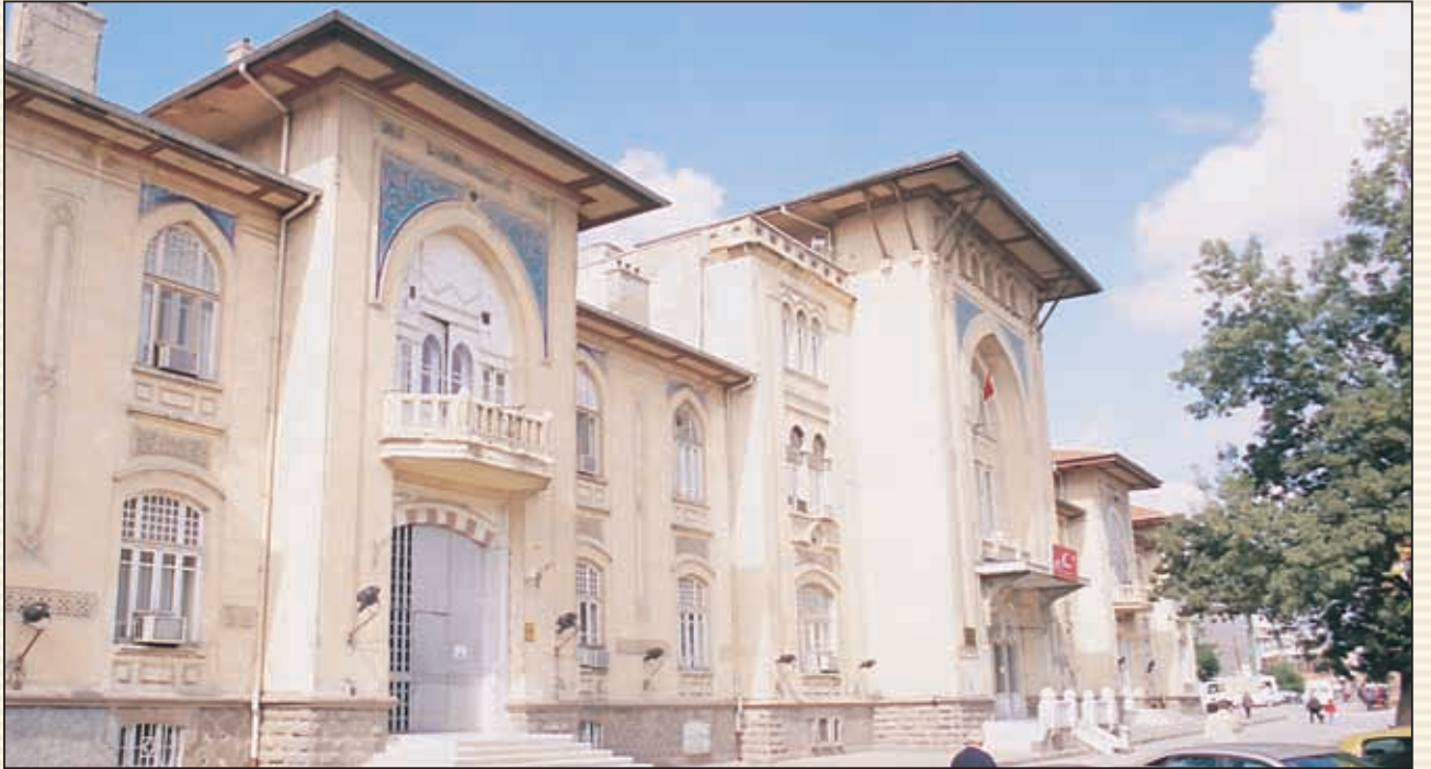
Gelirler Genel Müdürlüğü döneminde kullanılan Ulus'daki tarihi bina.

05.05.2005 tarihinde kabul edilen ve 16 Mayıs 2005 tarih ve 25817 sayılı Resmi Ga-