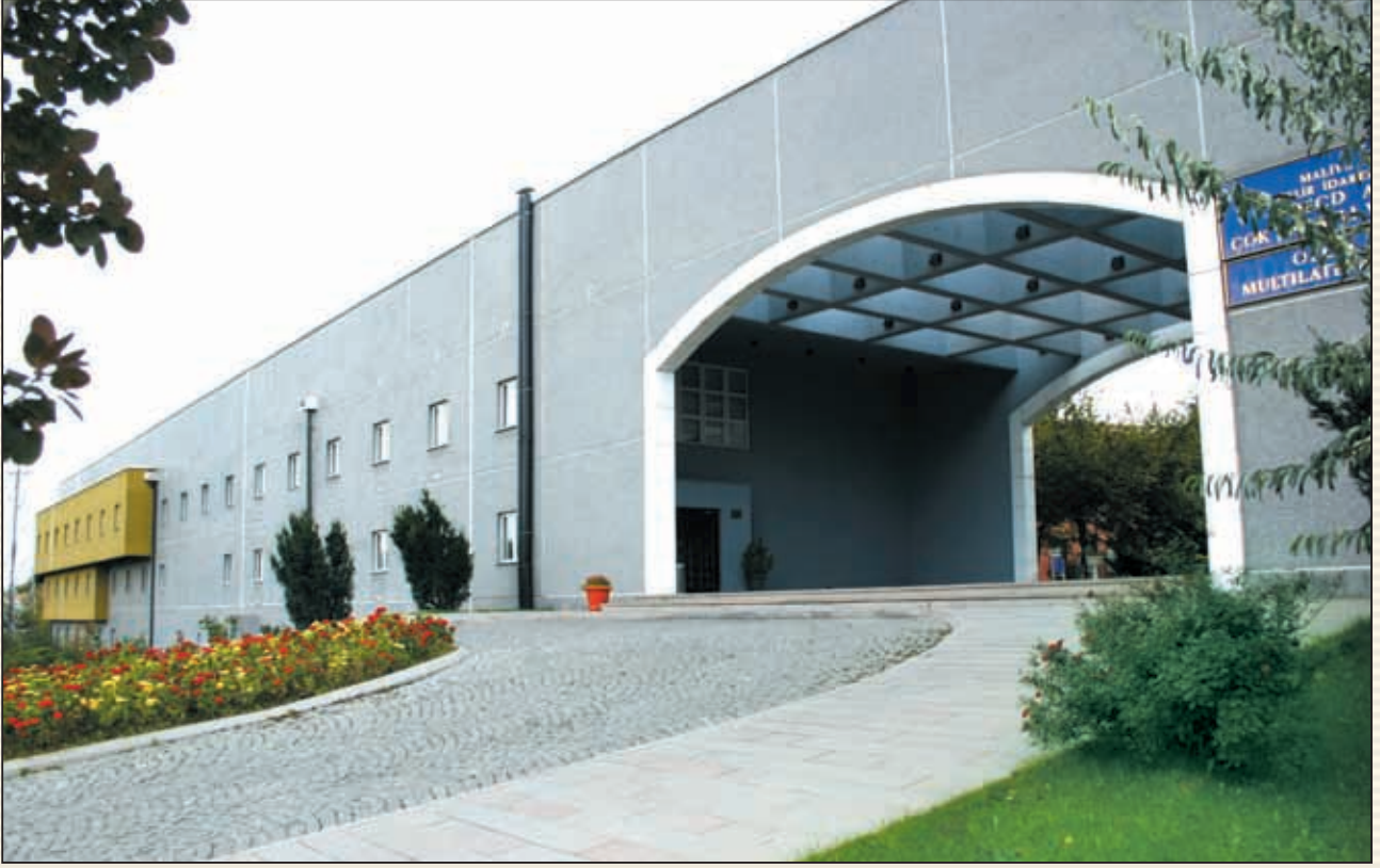
Gelir İdaresi Başkanlığı OECD Çok Taraflı Vergi Merkezi