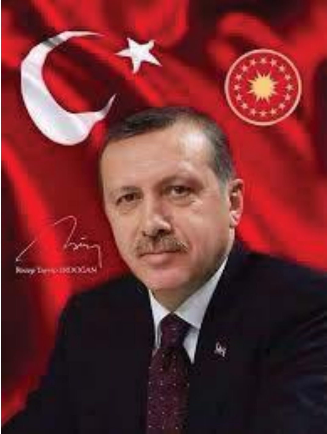
CUMHURBAŞKANI RECEP TAYYİP ERDOĞAN