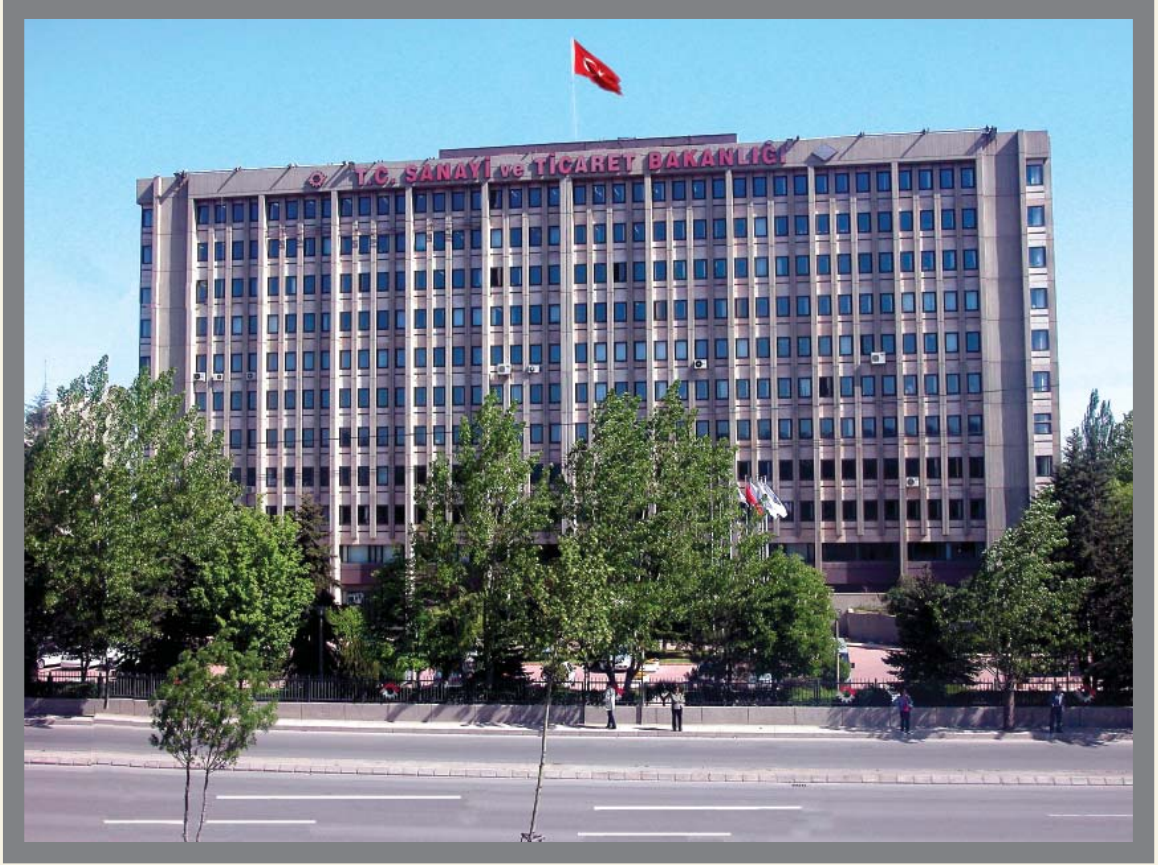
T.C. Sanayi ve Ticaret Bakanlıđı Merkez Binası