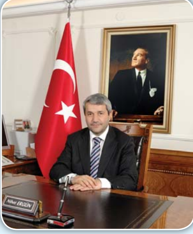
Nihat ERGÜN Sanayi ve Ticaret Bakanı

Dünya ekonomisinde 1970’li yılların sonlarından başlayarak ve 80’li yıllarda hızlanarak devam eden yapısal değişiklikler nedeniyle, birçok ülkede kamu sektörünün etkin ve verimli çalışmasına yönelik olarak reform programları geliştirilmiş ve uygulanmıştır.