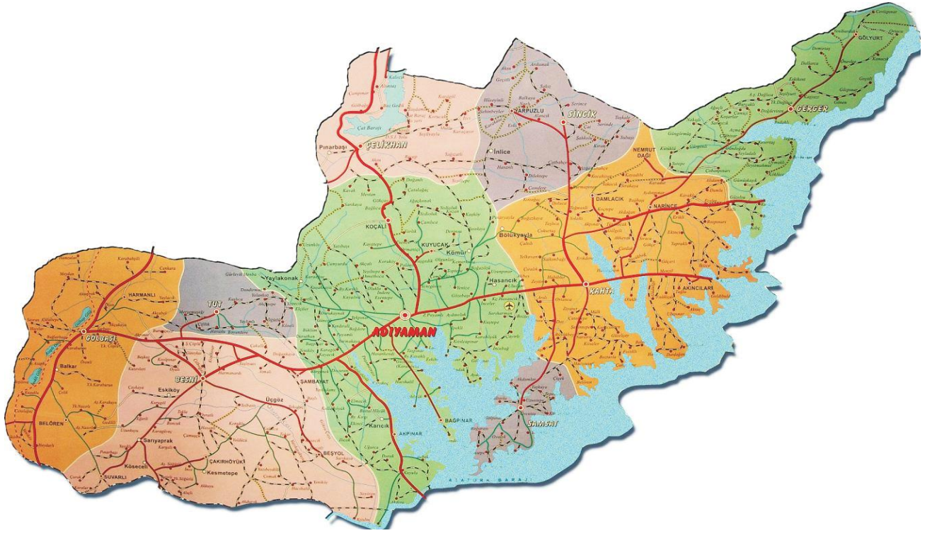
Adiyaman İli Haritası