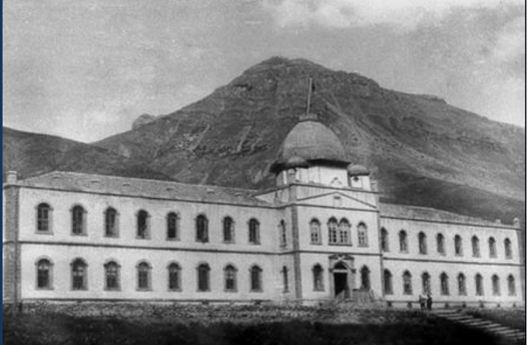
Eski Hükümet Konağı 1935