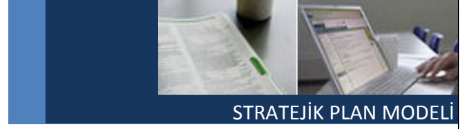
STRATEJİK PLAN MODELİ