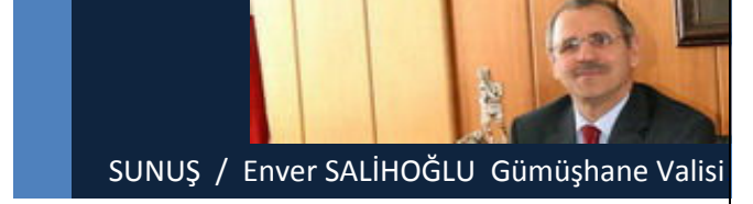
SUNUŞ / Enver SALİHOĞLU Gümüşhane Valisi

Planlı kalkınma Ülkemizde pek eski değildir. Devlet Planlama Teşkilatı kuruluncaya kadar bakanlıklar kendi alanlarında kısa vadeli planlar yapmışlarsa da diğer kuruluşlarla yeterli eş güdümü sağlayamadıklarından bu planlar ülke için bir bütünlük arz etmiyordu.