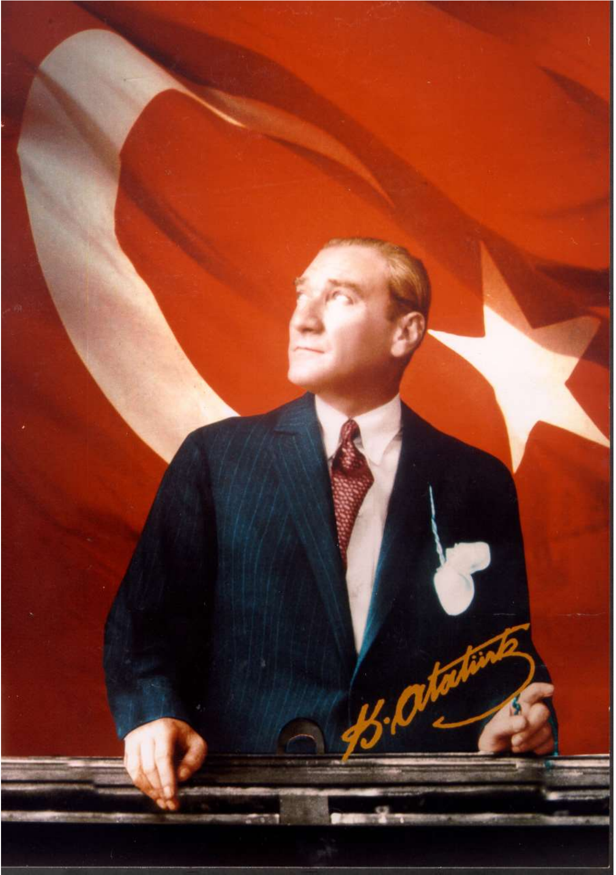
ULU ÖNDER MUSTAFA KEMAL ATATÜRK