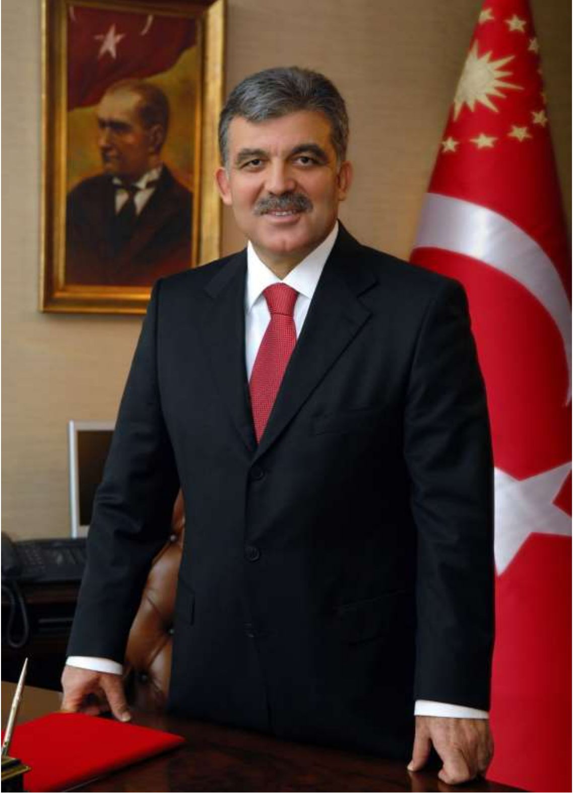
CUMHURBAŞKANI ABDULLAH GÜL