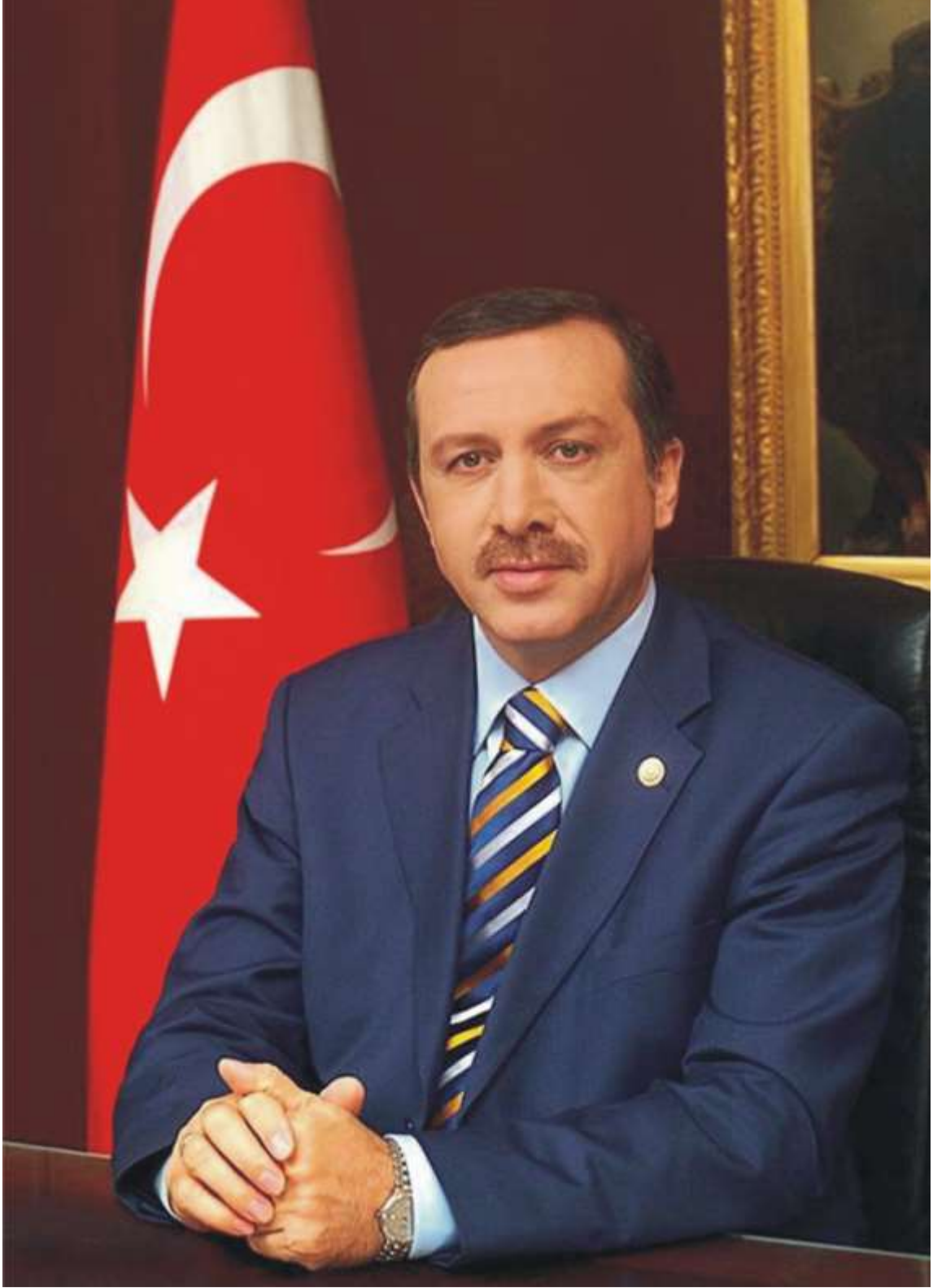
BAŞBAKAN RECEP TAYYİP ERDOĞAN