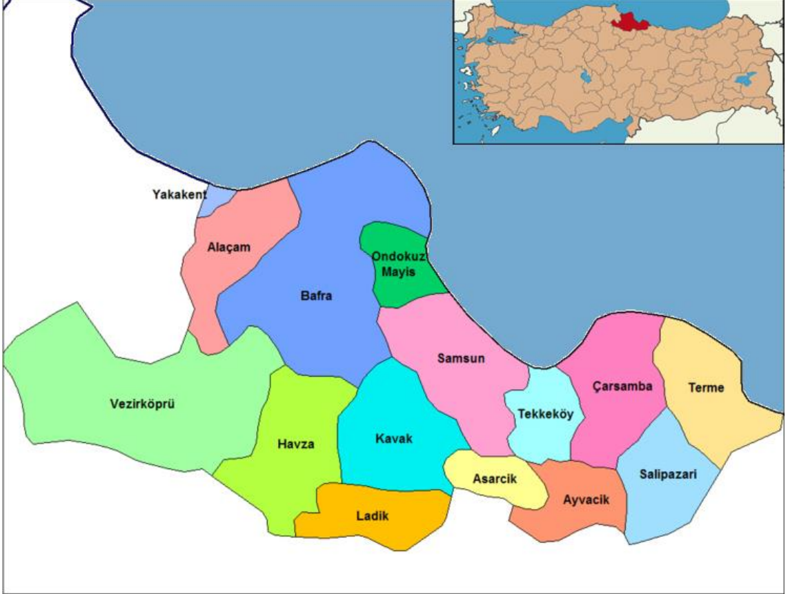
Şekil 1: İlçenin Coğrafi Konumu

Çarşamba, Karadeniz Bölgesi Orta Karadeniz bölümünde Samsun ilinin nüfusu bakımından 4. büyük ilçesi ve yüzölçümü bakımından 5.büyük ilçesidir. Batıda Tekkeköy, doğuda Terme, Güneyde Salıpazarı ve Ayvacık ilçeleriyle çevrilidir.