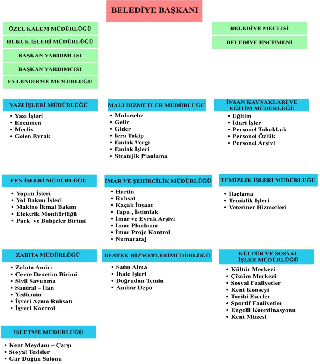
Şekil 3: Belediye Organizasyon Şeması