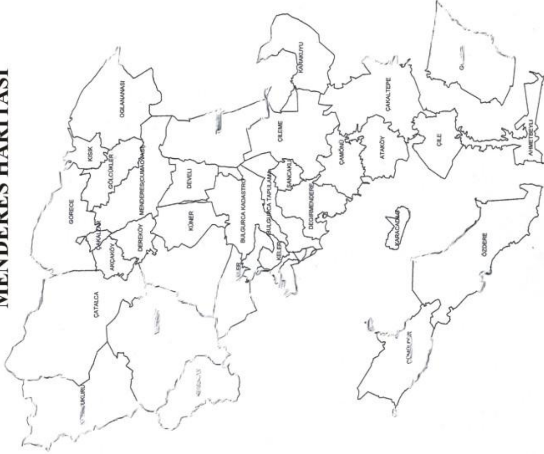
MENDERES BELEDİYESİ 2009 -2014 STRATEJİK PLANI