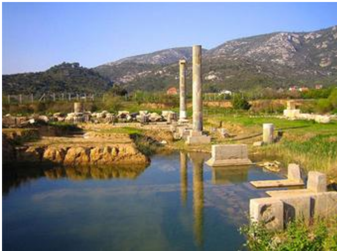
KLAROS ANTİK KENTİ

Ahmetbeyli köyü civarında ve deniz kenarında olmayan tek İyon kenti "Kolofon-Claros" bulunmaktadır.