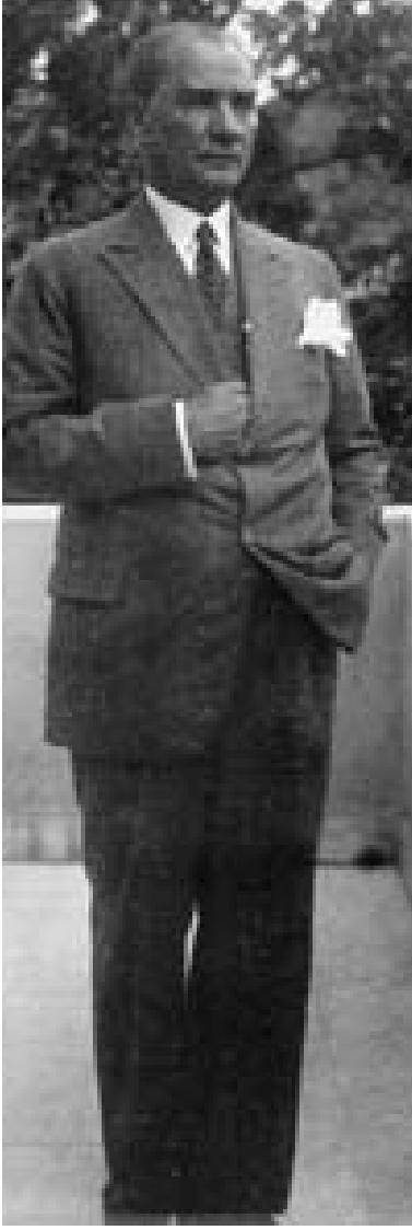
Atatürk, Yalova'da Köşkünün balkonunda, 1932