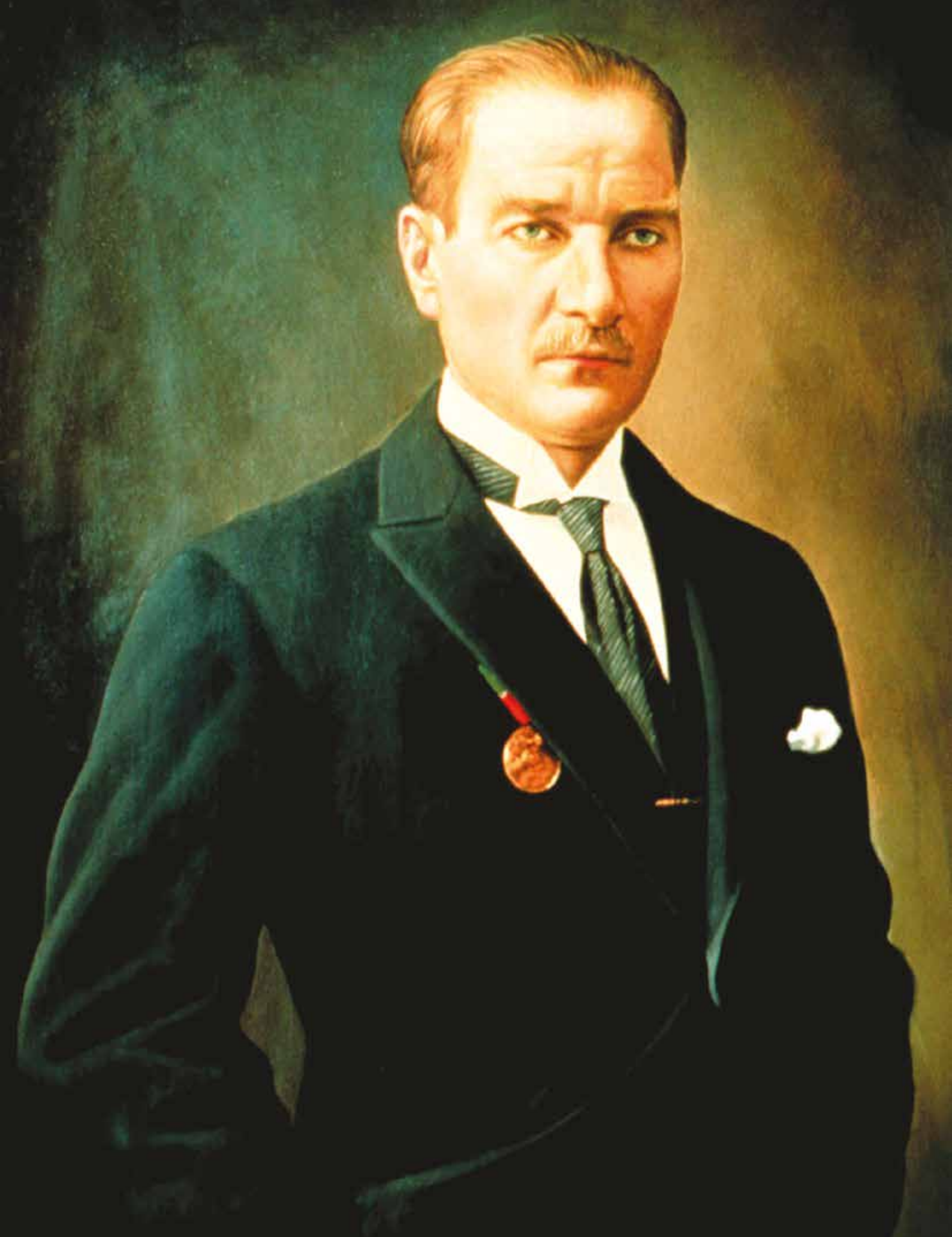
MUSTAFA KEMAL ATATÜRK Türkiye Cumhuriyeti Kurucusu