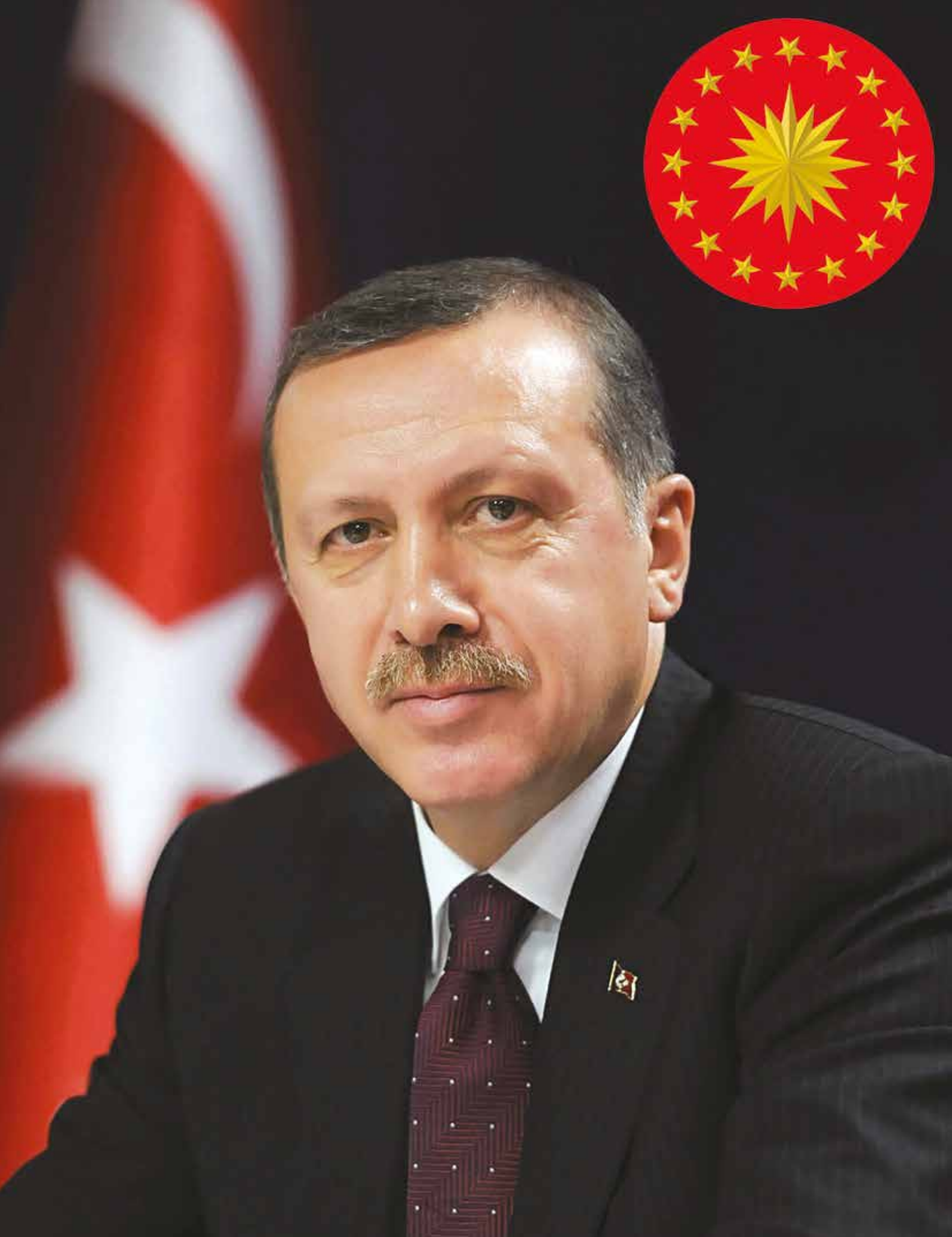
RECEP TAYYİP ERDOĞAN Türkiye Cumhuriyeti Cumhurbaşkanı