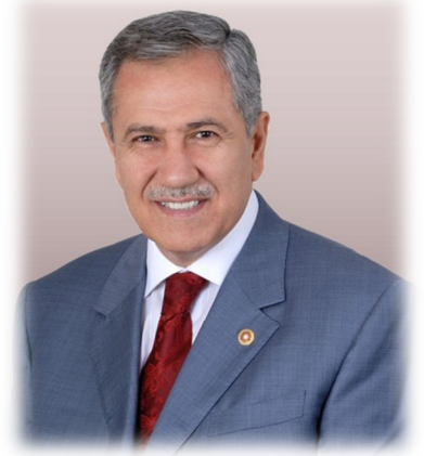
Bülent ARINÇ Başbakan Yardımcısı

20'nci yüzyılın son çeyreğiyle birlikte hız kazanan ekonomik, siyasal ve teknolojik gelişmeler, dünyada ve ülkemizde kamu hizmeti ve kamu yönetimi anlayışında ciddi değişimlere yol açmış; daha çok özel kesimde yaygınlık kazanmış olan stratejik planlama ve stratejik yönetim kavramları kamu yönetimine de taşınmıştır.