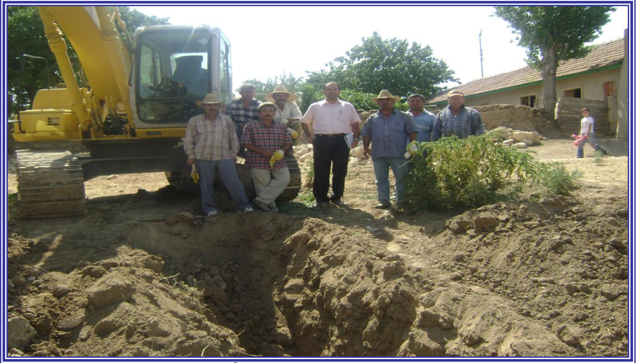
Köy İçme Suları Mevcut Durumu