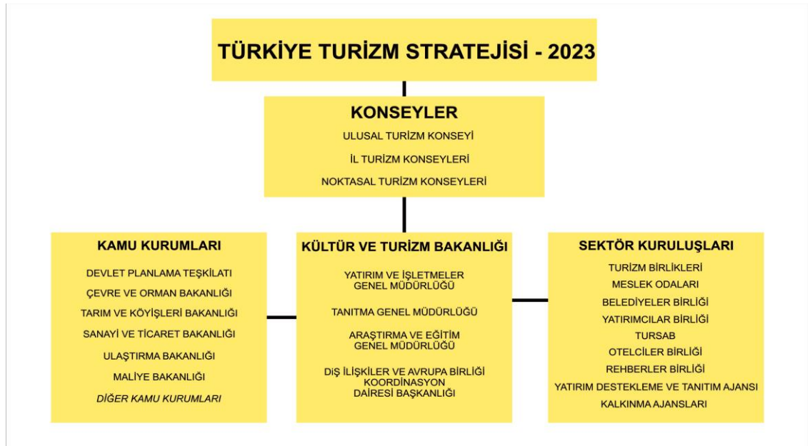
Grafik 1. Örgütlenme Şeması

Turizm strateji belgesinin uygulanması sürecinde faal olarak görev alacak kurum ve kuruluşların örgütlenme şeması aşağıda verilmektedir.